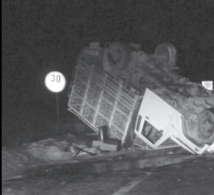
દાંતીવાડા મુખ્ય માર્ગ પર કેનાલની નજીક ગત મોડી રાત્રે રાજસ્થાન તરફથી આવતી જીપ નં. જીજે-૮ એસ-૧૮૮૮ના ચાલકે માર્ગ વચ્ચે આવેલી નીલગાયને બચાવવા જતા સ્ટેરીંગ પરનો કાબુ ગુમાવ્યો હતો. જીપ પલ્ટી ખાઈ ગઈ હતી. જે ઘટનામાં ચાલકનો આબાદ બચાવ થયો હતો.