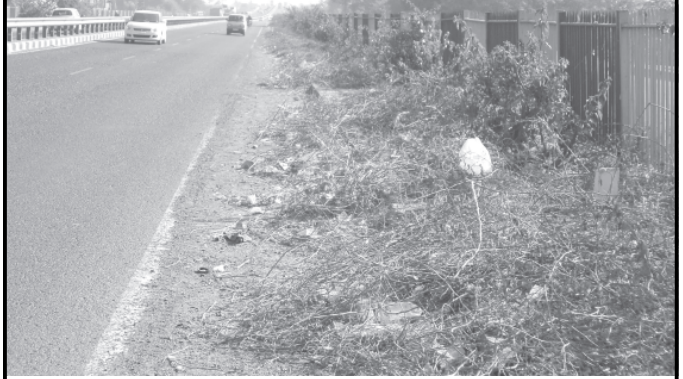
હિંમતનગર-અમદાવાદ માર્ગ પર પ્રાંતિજ નજીક માર્ગની વચ્ચેના ડીવાઈડર ઉપર ઉગી નીકળેલ કાંટાળી ઝાડીને તંત્ર દ્વારા દૂર કરવામાં આવે છે અને ઝાડીને બાદમાં માર્ગની બાજુમાં જ નાખી દેવામાં આવે છે. જેથી વાહનચાલકોના વાહનને પંચર પડી જાય છે અને અકસ્માત સર્જાય છે.