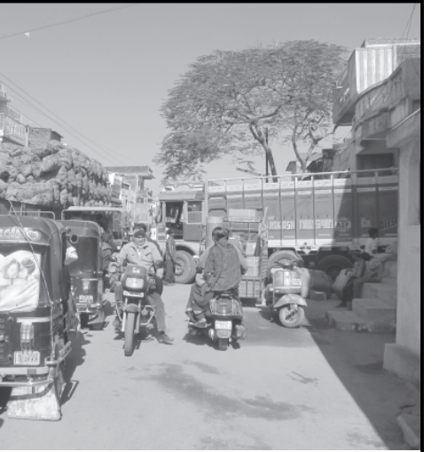
ડીસા પોલીસ મથકથી રાજપુરના માર્ગમાં ટ્રાફિક સમસ્યાથી વાહન ચાલકો પરેશાન