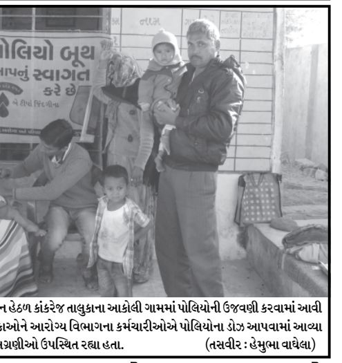
પોલિયો નાબુદી અભિયાન હેઠળ કાંકરજ તાલુકાના આક્રોલી ગામમાં પોલિયોની ઉજવણી કરવામાં આવી હતી. જેમાં ગામના નાના ભૂલકાઓને આરોગ્ય વિભાગના કર્મચારીઓએ પોલિયોના ડોઝ આપવામાં આવ્યા હતા. આ કાર્યક્રમમાં ગામના અગ્રણીઓ ઉપસ્થિત રહ્યા હતા.