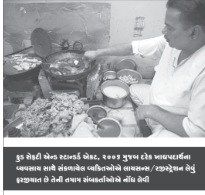
કુડ સેફ્ટી એન્ડ સ્ટાન્ડર્ડ એક્ટ, ૨૦૦૬ મુજબ દરેક ખાદ્યપદાર્થના વ્યવસાય સાથે સંકળાયેલ વ્યક્તિઓએ લાયસન્સ/રજીસ્ટ્રેશન લેવું ફરજિયાત છે તેની તમામ સંબંધતાઓએ નોંધ લેવી