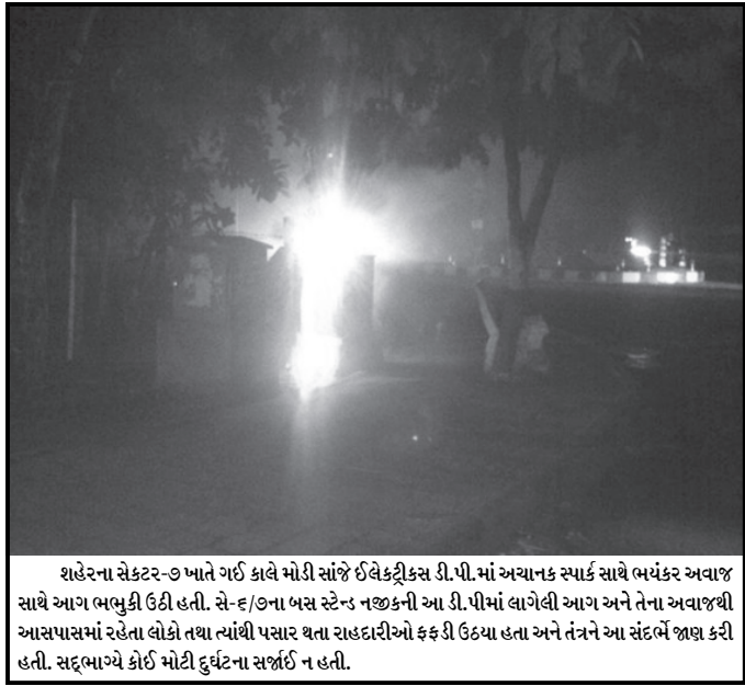
શહેરના સેક્ટર-૭ ખાતે ગઈ કાલે મોડી સાંજે ઈલેક્ટ્રીકલ ડી.પી.માં અચાનક સ્પાર્ક સાથે ભયંકર અવાજ સાથે આગ ભભુકી ઉઠી હતી. સે-૬/૩ના બસ સ્ટેન્ડ નજીકની આ ડી.પી.માં લાગેલી આગ અને તેના અવાજથી આસપાસમાં રહેતા લોકો તથા ત્યાંથી પસાર થતા રાહદારીઓ ફફડી ઉઠ્યા હતા અને તંત્રને આ સંદર્ભે જાણ કરી હતી. સદ્ભાગ્યે કોઈ મોટી દુર્ઘટના સર્જાઈ ન હતી.