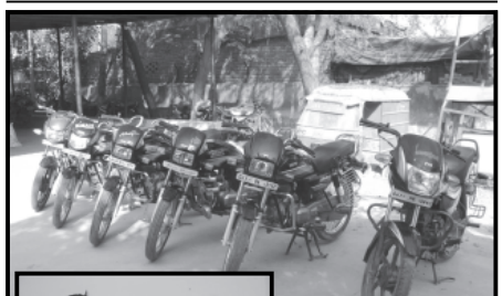
પાટણ એલ.સી.બી. ટીમે સિદ્ધપુર ખાતે ચાર રસ્તા ઉપર વાહન ચેકિંગ દરમિયાન વાહનચોરી અને અપહરણ ખંડણીના ગુનામાં સંડોવાયેલા બે ઈસમોને ઝડપી પાડ્યા હતા અને તેમને ક્રોડેટમાં રજૂ કરતા ક્રોડેટ આરોપીઓને પોલીસ રીમાન્ડ ઉપર મોકલી આપ્યા હતા. ઉપરાંત પોલીસ આ બંનેને વધુ પુછપરછ કરતા તેમને અન્ય સાત બાઈકચોરીની કબુલાત કરી હતી.

હિંમતનગર, તા. ૨૨ સાબરકાંઠા જિલ્લાના મુખ્યમથક હિંમતનગરમાંથી સોમવારે સાંજે એક યુવતીને કારમાં ખેંચી લઈ જવાનો નિષ્ફળ પ્રયાસ થતા હિંમતનગર ટાઉન પોલીસ મથકે યુવતીએ ફરિયાદ નોંધાવતા પોલીસે કાર ચાલક અને અન્ય એક મળી બે વિરૂદ્ધ ગુનો નોંધી કાયદેસરની કાર્યવાહી હાથ ધરી હતી.