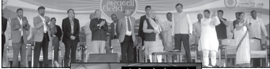
મોડાસા, તા. ૨૫