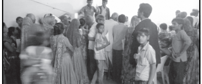
ગાંધીનગર તાલુકાના ડબોડા ખાતે જનસેવાકેન્દ્ર આપના દ્વારા અંતર્ગત કાર્યક્રમો શુભારંભ થયો હતો. ત્યારબાદ ડબોડા હનુમાનજી મંદિરના હોલ ખાતે આધારકાર્ડ કઠાવવાની કામગીરી આરંભાઈ છે. આ હોલ ખાતે વહેલી સવારથી મોટી સંખ્યામાં લોકો આધારકાર્ડ માટે ભારે ઉસુકતા દર્શાવતા નુ દિવસો સુધી કામગીરી ચાલુ રહે તેવી પ્રજાજનોની માંગ પ્રવર્તી રહી છે.

પરીક્ષાના તાલીમાર્થી વિદ્યાર્થી ભાઈ-બહેનોનો પણ આ આયોજનમાં સહયોગી બળ પુરૂ પાડ્યું છે. આ કોન્ફરન્સ દરમ્યાન રાજપૂત સંસ્કૃતિ અને તેની જાળવણીમાં રાજપૂતઓનો ફાળો બાળ ઉંદર, આરોગ્ય, રોજગારી, સશક્તિકરણ, ઉત્તમ કેળવણી, મહિલાઓના પ્રશ્નો અને તેમના કાયદાકીય અધિકારો, મહિલા નેતાગીરી વગેરે વિવિધ વિષયો ઉપર નિષ્ણાંતો દ્વારા છણાવટ કરવામાં આવશે તેમજ માર્ગદર્શન પુરૂ પાડવામાં આવશે.