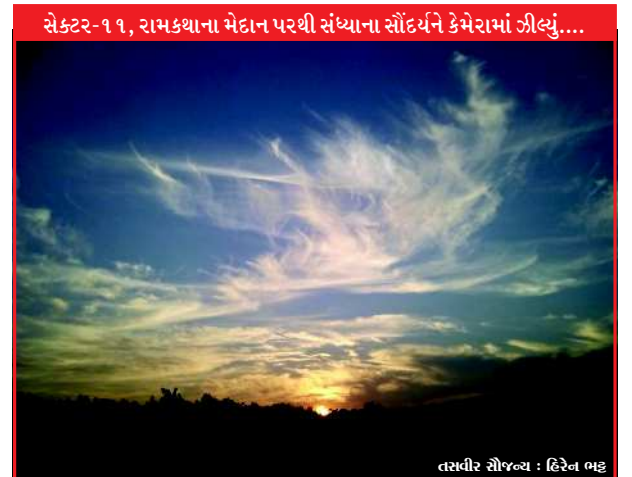
સેક્ટર-૧૧, રામકથાના મેદાન પરથી સંધ્યાના સૌંદર્યને કેમેરામાં ઝીલ્યું....

મહાનગરપાલિકાનું આ ત્રીજું બજેટ છે અને તેથી તેનું કદ