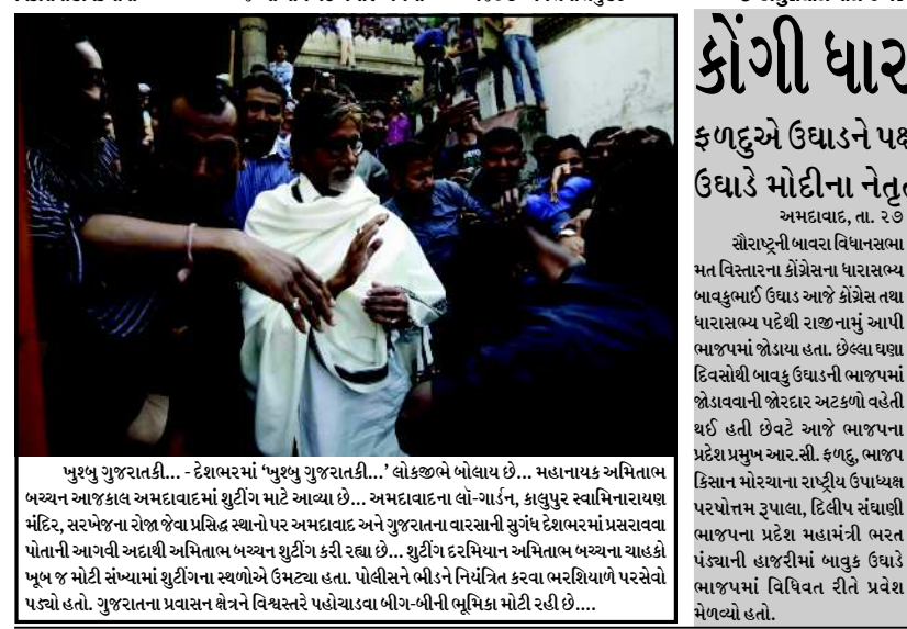
પુરુષુ ગુજરાતકી... દેશભરમાં 'પુરુષુ ગુજરાતકી...' લોકજીભે બોલાય છે... મહાનાયક અમિતાભ બચ્ચન આજકાલ અમદાવાદમાં શુટીંગ માટે આવ્યા છે... અમદાવાદના લોન્ગ-ગાર્ડન, કાલુપુર સ્વામિનારાયણ મંદિર, સરખેજના રોજ જેવા પ્રસિદ્ધ સ્થાનો પર અમદાવાદ અને ગુજરાતના વારસાની સુગંધ દેશભરમાં પ્રસરાવવા પોતાની આગવી અદાથી અમિતાભ બચ્ચન શુટીંગ કરી રહ્યા છે... શુટીંગ દરમિયાન અમિતાભ બચ્ચનના ચાહકો ખૂબ જ મોટી સંખ્યામાં શુટીંગના સ્થળોએ ઉમટ્યા હતા. પોલીસને ભીડને નિયંત્રિત કરવા ભરદિવાળી પરવેરો પહોંચી હતા. ગુજરાતના પ્રવાસન ભેતરને વિશ્વસ્તરે પહોંચાડવા બીજ-બીની ભૂમિકા મોટી રહી છે....