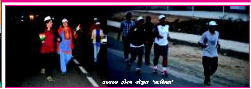
કલ્પવૃક્ષ હોટમ વોલ્યુન્ટરી 'પ્રદક્ષિણા'