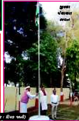
ગુલા પંચાયત ભવન