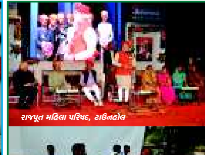
રાજપૂત મહિલા પરિષદ, ટાઉનહોલ