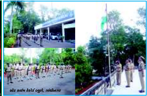
સ્ટેટ કાર્મ રેકોર્ડ બુરો, ગાંધીનગર