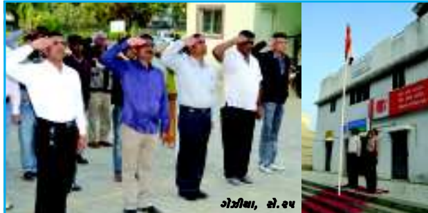
ગોરીયા, સે. ૨૫