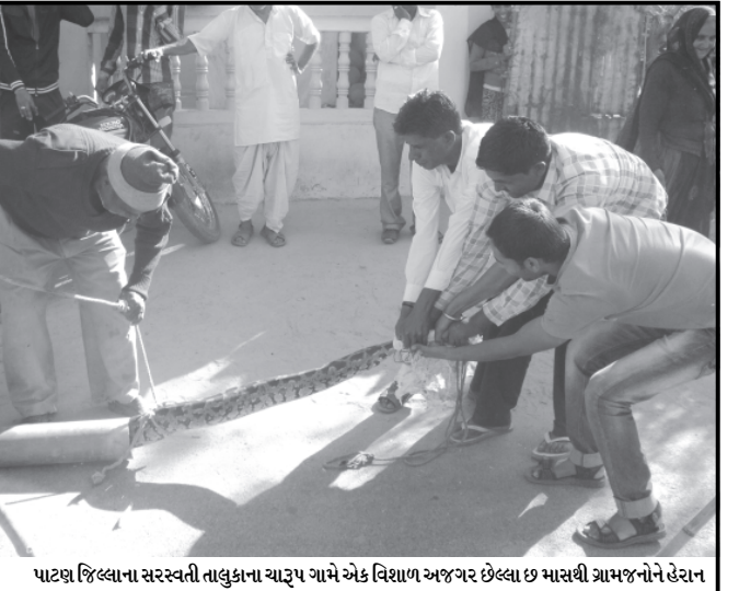
પાટણ જિલ્લાના સરસ્વતી તાલુકાના યાડપ ગામે એક વિશાળ અજગર છેલ્લા છ માસથી ગ્રામજનોને હેરાન પરેશાન કરી રહ્યો છે. ત્યારે આજે ગ્રામજનોએ ૧૧ ફૂટ લાંબા અને ૪૦ કિલો વજનના મહાકાય અજગરને પકડી પાડ્યો હતો અને વન વિભાગના કર્મચારીઓને મોકલી આપ્યો હતો.

ગોધીનગર, તા. ૨૮ દાઉદી બોહરા કોમના ધાર્મિક વડા ધર્મગુરુ હીજ હોલીનેસ ડૉ. સૈયદના અબુલકાઈદ જોહર મોહમદ બુરહાનુદીન સાહેબ (રી.અં.)ના દુઃખદ અવસાન બાદ, અમદાવાદમાં વસતા સમગ્ર દાઉદી બોહરા સમાજના અનુયાયીઓ તથા ડૉ. સૈયદના સાહેબની કામગીરીમાં શ્રદ્ધા ધરાવતા લોકોની શોકસભા કુતબી મઝાર, દાઉદી બોહરાના રોજ, અમદુપુરા, સરસાપુર, અમદાવાદ ખાતે અજાે તા. ૨૮ બુધવારના રોજ રાત્રે ૭.૦૦ વાગે રાખેલ છે.