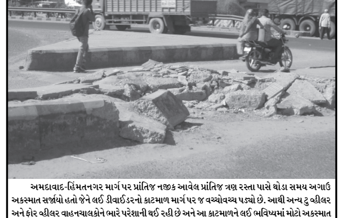
અમદાવાદ-હિંમતનગર માર્ગ પર પ્રાંતિજ નજીક આવેલ પ્રાંતિજ ત્રણ રસ્તા પાસે થોડા સમય અગાઉ અકસ્માત સર્જાયો હતો જેને લઈ રીવાઈ ડરનો ક્રાટમાળ માર્ગ પર જ વચ્ચેવચ્ચ પડ્યો છે. આથી અન્ય ટુ વ્હીલર અને ફોર વ્હીલર વાહનચાલકોને ભારે પરેશાની થઈ રહી છે અને આ ક્રાટમાળને લઈ ભવિષ્યમાં મોટો અકસ્માત સર્જાય તેવી પણ ભીતી સર્જાઈ રહી છે.