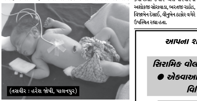
(તસવીર : હરેશ જોષી, પાલનપુર)

પાલનપુર, તા.૨૬ આગળ આવેલ નારી કેન્દ્ર સરકાર ભલે બેટી મુકવામાં આવેલ પારણામાં બચાવો અભયાન થકી જન અડધા માસે જન્મેલી જીવિત બાળકી લાવવાનો લોકોમાં પ્રયાસ કરતી હોય છતાં પણ કેન્દ્રના સત્તાધીશોએ બાળકીને હજુ તાજી જન્મેલી બાળકીને સાસ્વાર માટે સિવિલ હોસ્પિટલમાં આઈ.સી.યુ.માં ખસેડવામાં આવી હતી. બે કે પાલનપુર જિલ્લાના ત્વજી દેનાર બાળકીના માતા હેડક્વાર્ટરમાં આવેલ વિલ્લા પ્રત્યે લોકોએ ફીટકારની પોલિસ વડાના બંગાલાની લાગણી વર્ષાવી હતી.