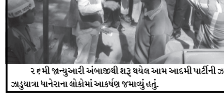
૨૬મી જાન્યુઆરી અંબાજીથી શરૂ થયેલ આમ આદમી પાર્ટીની ઝડુયાત્રા ધાનેરા આવી પહોંચતા ધાનેરાના જાહેર માર્ગે ઉપર આ ઝડુયાત્રા ફરી હતી અને આમ આદમી પાર્ટીની ઝડુયાત્રા ધાનેરાના લોકોમાં આકર્ષણ જમાવ્યું હતું.

પાલનપુર, તા.૨૬ આગળ આવેલ નારી કેન્દ્ર સરકાર ભલે બેટી મુકવામાં આવેલ પારણામાં બચાવો અભયાન થકી જન અડધા માસે જન્મેલી જીવિત બાળકી લાવવાનો લોકોમાં પ્રયાસ કરતી હોય છતાં પણ કેન્દ્રના સત્તાધીશોએ બાળકીને હજુ તાજી જન્મેલી બાળકીને સાસ્વાર માટે સિવિલ હોસ્પિટલમાં આઈ.સી.યુ.માં ખસેડવામાં આવી હતી. બે કે પાલનપુર જિલ્લાના ત્વજી દેનાર બાળકીના માતા હેડક્વાર્ટરમાં આવેલ વિલ્લા પ્રત્યે લોકોએ ફીટકારની પોલિસ વડાના બંગાલાની લાગણી વર્ષાવી હતી.