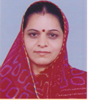
ચંદ્રાબા જે યુસાસમા સહમંત્રી, શ્રી ગાંધીનગર રાજપૂત મહિલા મંડળ