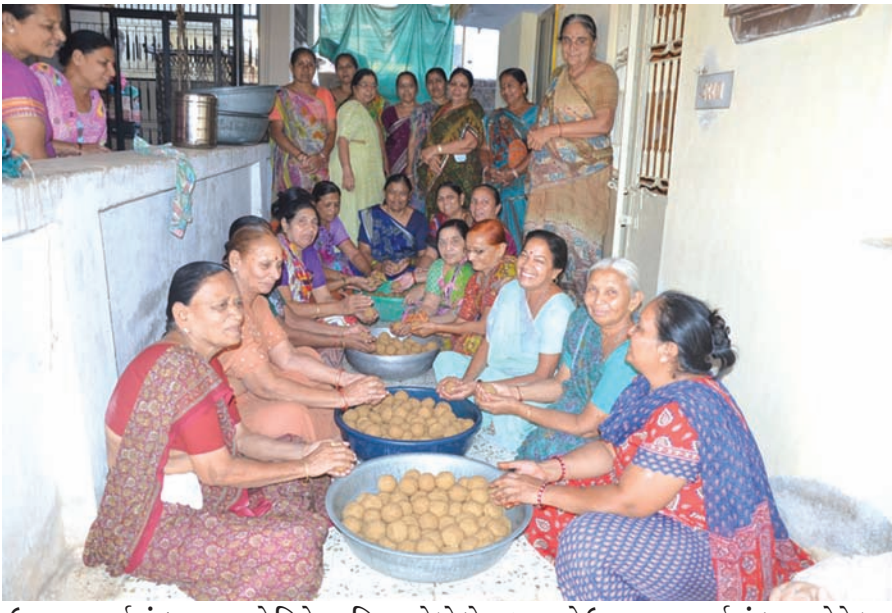
ઉત્તરાયણ પર્વમાં દાન-પુણ્યનો વિશેષ મહિમા રહેલો છે. નગરજનો ઉત્તરાયણના પર્વમાં કુતરાઓને લાડુ ખવડાવી પુણ્યનું ભાથુ બાંધે છે. ત્યારે શહેરના સેક્ટર-૫-એ મહિલા મંડળ દ્વારા મકરસંક્રાંતિ નિમિત્તે લાડુ બનાવવાની કામગીરીનો આરંભ થઈ ગયો છે. આ લાડુ મહિલા મંડળ દ્વારા પર્વ દરમિયાન સેક્ટરના કુતરાઓને ખવડાવી પુણ્યનું કામ કરવામાં આવશે.