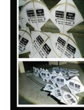
સંગઠિત થઈએ, અધિકાર લઈએ બાબતે રાજ્ય સરકાર સામે લડત છેડવામાં આવી રહી છે. લાંબા સમયથી ફિક્સ પગારદાર રહેલા