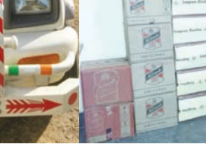
પેટીઓ અને બિયરના ટીનની પેટીઓ મળી ૭૮ નંગ દારૂ-બિયરની પેટીઓ (૨૦૦૪ નંગ) મળી આવી