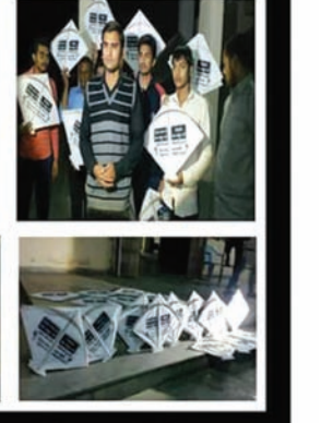
પગારદારોએ અજમાવેલો કિમિયો હવે હવામાં કેટલો ઉંચે ચઢે છે કે પછી ગોથા ખાશે તે જોવું રહ્યું.