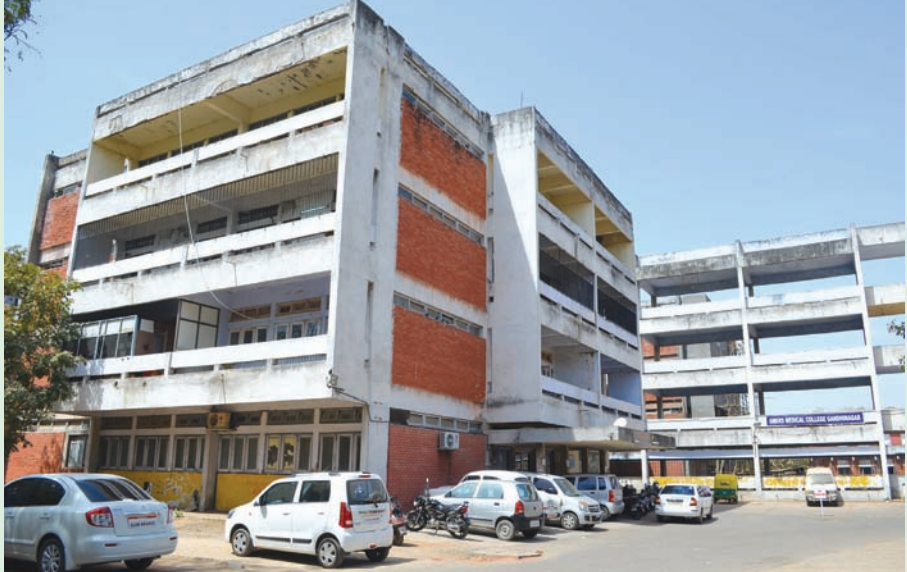
દર્દીઓને ભીડ અને લાબી લાઈનોમાંથી રાહત મળી છે. મેડીકલ કોલેજ બનાવવામાં પણ વાહનોનો ધસારો છે. સિવિલમાં વાહનચોરને મોકળું મેદાન મળી ગયું છે. હોસ્પિટલમાંથી આંતરે દિવસે

ગાંધીનગર તા, ૪ ગાંધીનગર સિવિલ કેમ્પસમાં પાર્કિંગને લઈ દરરોજ સમસ્યાઓ સર્જાય છે. સિવિલમાં સારવાર માટે આવતા જિલ્લાભરના દર્દીઓ, સગાઓ, અને સ્ટાફના કર્મીઓ આડે ધડ વાહનો પાર્ક કરતા પાર્કિંગની સમસ્યા સર્જાય છે. તાજેતરમાં પોલીસ દ્વારા આડે ધડ પાર્કિંગના પ્રશ્ને વાહનચાલકો પાસે દંડનીય કાર્યવાહી કરી હતી. જેને પગલે સ્ટાફના કર્મીઓ પણ સિવિલના ઉચ્ચ અધિકારીઓ પાસે પાર્કિંગના પ્રશ્ને દોડી ગયા હતા. જ્યારે અધિકારીઓએ પણ વાહનોના ધસારાને કારણે કેમ્પસમાં નવિન ૨ પાર્કિંગ બનાવવાની વિચારણા ચાલી રહી છે.