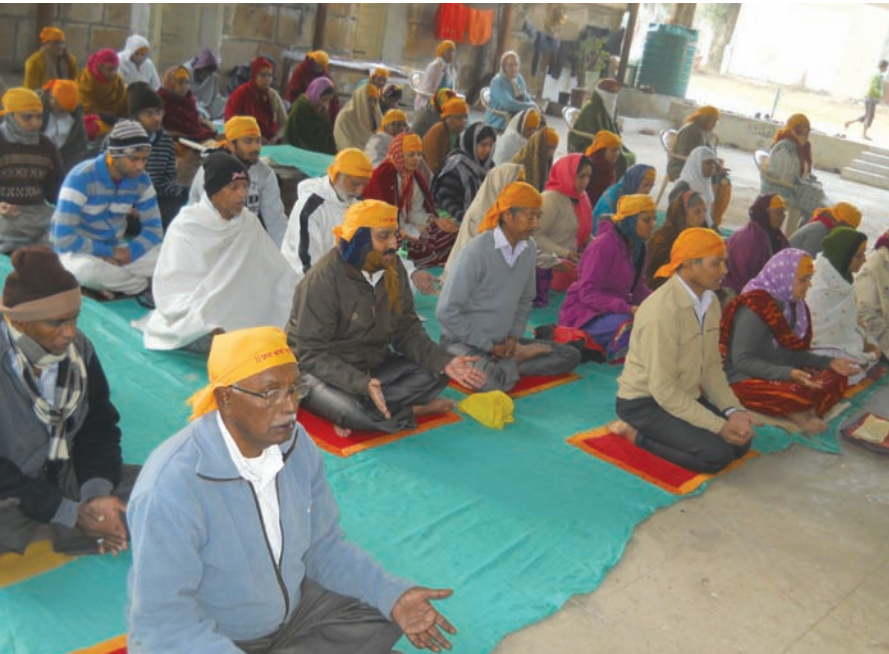
ધ્યાન શિબિર : પંચદેવ મંદિરના પ્રાંગણમાં ધ્યાન શિબિરનું આયોજન કરાયું હતું. જપ અને ધ્યાન ભક્તિ માર્ગના મહત્વના અંગો છે. ધ્યાન અનુભૂતિનો વિષય છે. આજકાલ ધ્યાન યોગ શિબિરનો વધતો મહિમા આધ્યાત્મિક ક્ષેત્રમાં ઉંચાં સ્થાને પહોંચ્યો છે. શહેરના ગ્રામદેવતા સમા પંચદેવ મંદિરના સાંનિધ્યમાં ભાવિકો ધ્યાન શિબિરમાં મોટી સંખ્યામાં જોડાયા હતા.

સમગ્ર ગુજરાત સૌરાષ્ટ્રમાં હાલમાં ઠંડી ગરમીનો મિશ્ર અહેસાસ થઈ રહ્યો છે. આજે મહત્તમ તાપમાન ૩૨.૫ ડિ.સે. અને લઘુત્તમ તાપમાન ૧૧.૮ ડિ.સે. જેટલું નોંધાયું છે. કેટલાક સમયથી તાપમાનમાં વધઘટ થવા સાથે ઠંડી ગરમીનો અહેસાસ યથાવત રહ્યો છે. દિવસે ગરમી અને રાત્રે વાતાવરણમાં ઠંડક અનુભવાય છે. ગયા શનિવારથી સમગ્ર ગુજરાતમાં બદલાયેલા વાતાવરણની અસર હેઠળ ગરમીનો અહેસાસ થતો હતો. લઘુત્તમ તાપમાન ૧૫ ડિગ્રીની નજીક પહોંચતા ઠંડી જાણે ગાયબ થઈ ગઈ હતી. જો કે છેલ્લા એકાદ-બે દિવસથી લઘુત્તમ તાપમાન થોડુંક ઘટ્યું છે. પવનની ગતિ વધતા રાત્રે ફરીથી થોડીક ઠંડીની અસર વર્તાઈ છે. જો કે દિવસે હજુ મહત્તમ તાપમાન ૩૦ ડિગ્રીથી વધુ રહેતા દિવસે પંખા ચાલુ કરવા પડે છે. આજે મહત્તમ તાપમાન ૩૨.૫ ડિ.સે. અને લઘુત્તમ તાપમાન ૧૧.૮ ડિ.સે. નોંધાયું હતું. જ્યારે ભેજનું પ્રમાણ સવારે ૭૫ ટકા અને સાંજે ૭૬ ટકા રહ્યું હતું. આગામી સપ્તાહે તાપમાનનો પારો નીચે ઉતરવાનું શરૂ થતાં આવતા સપ્તાહમાં ફરી ઠંડીનું આક્રમણ શરૂ થવાની આગાહી હવામાન વિભાગે કરી છે.