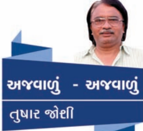
અજવાળું - અજવાળું તુષાર જોઈ

શિયાળાની કડકડતી ઈડીનો સમય વર્ષ ૨૦૧૫ને વિદાય આપીને ૨૦૧૬ને વધાવવાનો મુઠ્ઠામાં મસ્ત અમદાવાદીઓ માણેકચોકની ખાણી-પીણીની બજારમાં ઉમટી પડ્યા હતા. ત્યાં સુધી પહોંચવાના જાહેર માર્ગો પર વાહનોના ખડકલા થઈ ગયા હતા. માણેકચોકની આ બજારમાં એમ કહોને કે ઉભા રહેવાની પણ જગ્યા ન હતી. એમાં મજાની વાત એ હકીકે આટલી ભીડ વચ્ચેથી પણ સ્થાનિક લોકોની કાર અને સ્કૂટર ગમે તે રીતે રસ્તો કરીને પણ આવતા-જતા હતા. દિવસે આ વિસ્તારમાં સોના-ચાંદીના મુલ્યવાન