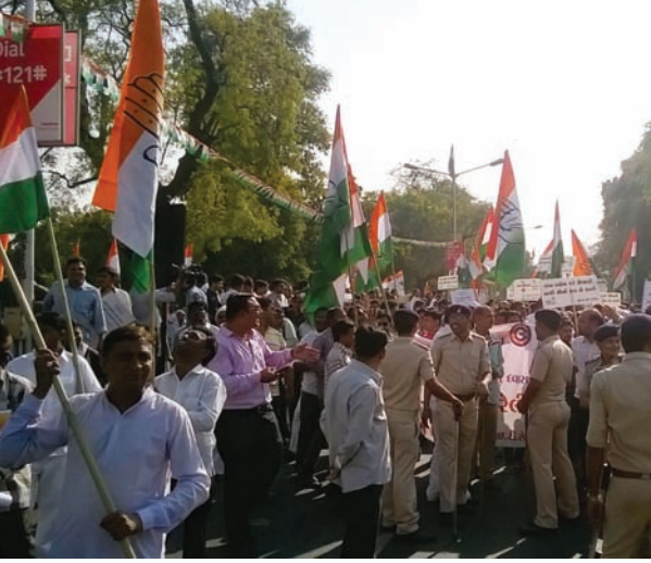
દમન પ્રતિકાર રેલી : કોંગ્રેસ દ્વારા પાટીદાર આંદોલનના થયેલા પોલીસ દમન સંદર્ભે 'દમન પ્રતિકાર રેલી' ગાંધી આશ્રમ ખાતે યોજાઈ હતી. પોલીસના ભારે બંદોબસ્ત વચ્ચે યોજાયેલ રેલીમાં સંખ્યાબંધ કાર્યકરોની અટકાયત કરી રેલી નિષ્ફળ બનાવી હતી. સાથે સાથે ગુજરાતના અન્ય શહેરોમાંથી રેલીમાં જોડાવા આવતા કાર્યકરોને જે તે શહેરોમાં જ અટકાયત કરી હતી. જેથી રેલી યોજાઈ જ ન શકે. આમ છતાં કોંગ્રેસના કાર્યકરો દ્વારા છુટાછવાયા પ્રમાણમાં રેલી નિકાળવાનો પ્રયાસ થયો હતો.

એકમેકની હાજરીથી ગુંગળામણ પણ ન થવી જોઈએ. દુનિયાના લોકો જોઈ શકે કે વ્યક્તિ સ્વતંત્ર અને સુકત છે, પરંતુ વ્યક્તિ જાણે છે કે તે પ્રેમ વિના કેદી અને અપંગ છે. તે કશું કરી શકતો નથી. ટૂંકમાં પ્રેમની કેદ માણસને કેદ લાગતી નથી. એમાં તે સ્વતંત્રતા અને સુરક્ષા અનુભવે છે. પોતાના પ્રિયજન પોતાના ઉપર કાળજી અને સંભાળની વર્ષા કરી દે ત્યારે એકાદ શ્લોક પ્રિયજનને એમાં ગુલામીની માનસિકતા કે માલિકીપણાંની ભાવના પણ અનુભવાય છે. પરંતુ ખરેખર તો એમાં સામી વ્યક્તિનો પ્રેમ, કાળજી, નિસબત અને સંબંધનું ટકાઉપણું જ સમાયેલાં હોય છે. પ્રેમનું આકાશ અને મોકળાશ-સ્પેસ પ્રિય વ્યક્તિ જ આપી શકે. પ્રેમનો સ્વાદ પોતાને પ્રેમ કરતી વ્યક્તિ જ ચખાડી શકે. પ્રેમનું રસાયણ કે દવા કોઈ ફાર્મા કંપની બનાવી શકે નહીં કે કોઈ મેડિકલ સ્ટોરમાં જઈને ખરીદી શકાય નહીં. જ્યારે બીજી વ્યક્તિ પોતાનો પ્રેમ આપવા માટે પોતાનું સમગ્ર અસ્તિત્વ અર્પણ કરે છે અને પોતાની ભીતરનું દ્વાર ખોલે છે ત્યારે જ પહેલી વ્યક્તિ પ્રેમમાં, પ્રિયજનમાં પ્રવેશ કરી શકે છે. પ્રેમ સ્વતંત્રતા પણ છે અને જાતે પસંદ કરેલી ગમતીલી કેદ પણ છે. પ્રેમમાં પૂર્ણ સમર્પણ એટલે ભક્તિની પરાકાષ્ટા. આવી ભક્તિ જ મુક્તિનો અનુભવ કરાવે છે. મહત્વની વાત એટલી જ કે આમ કરવા માટે પ્રેમ અને પ્રેમી પાત્ર અનિવાર્ય છે. પ્રેમ વિના બધું જ નકામું છે.