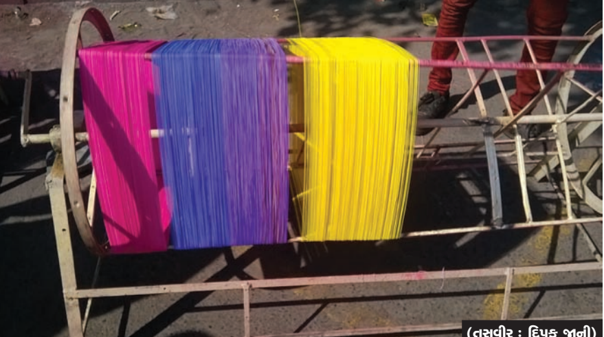
(તસવીર : દિપક પાની) ઉત્તરાયણનું કોઈન્ટ-ડાઉન - પતંગ પર્વની આડે હવે માત્ર દસ જ દિવસ બાકી છે ત્યારે બજારમાં પતંગ અને દોરીની ખરીદી માટેની ચલણપહલ આરંભાઈ છે... પતંગોત્સવની ખરીદી મજા દોરીથી જ આવે એવું પતંગવેરીઓનું માનવું છે... કાચી દોરી ખરીદી એને પીવરાવવાની મજા કરી અનોખી હોય છે... અસરકારકતા વધારવા દોરી પીવરાવનારાઓ પર આધારિત છે... આજકાલ ગાંધીનગરમાં પણ દોરી પીવરાવવાના ચરખા દેર દેર જોવા મળે છે...

ભોરીજ રેન્જમાંથી તંત્રને ઉપ લાખની આવક : ગત જુલાઈ દરમિયાન તોફાની વરસાદમાં સેંકડો વૃક્ષો જમીન દોસ્ત થયા હતા ગાંધીનગર તા. ૫ ગત જુલાઈ દરમિયાન આવેલા તોફાની વરસાદ દરમિયાન જિલ્લામાં સેંકડો વૃક્ષો જમીન દોસ્ત થતા હરિયાળીનો સોથ વળી ગયો હતો. જ્યારે આ વૃક્ષોને આડશરૂપ થતા દુર કરવા માટે પણ વન વિભાગની ટીમે લાંબા સમય સુધી કામ કર્યું હતું. જ્યારે આ વૃક્ષોમાંથી થયેલી લાકડાની હરાજીમાંથી વન વિભાગને ભોરીજ રેન્જમાંથી રૂ. ૩૫ લાખની આવક થઈ છે. ગાંધીનગર શહેરમાં ગત જુલાઈ દરમિયાન ભારે પવન સાથે તોફાની વરસાદ ખાબકતા શહેરમાં મોટા પ્રમાણમાં નુકશાન થયું હતું. જ્યારે શહેર તેમજ જિલ્લામાં સેંકડો વૃક્ષો પણ જમીન દોસ્ત થયા હતા. આ વૃક્ષોને દુર કરવા માટે વન