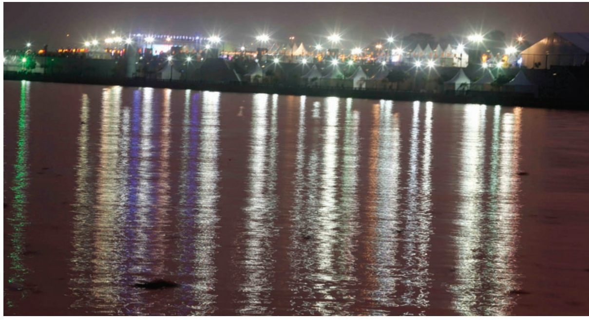
રિવરફ્રન્ટ ખાતે હાલમાં જુદા જુદા કાર્યક્રમો ચાલી રહ્યા છે સાથે સાથે કેટલાક નવા કાર્યક્રમો પણ યોજનાર છે જેને લઈને રિવરફ્રન્ટ ખાતે જોરદાર સજાવટ કરવામાં આવતા આકર્ષણ જમાવ્યું છે.