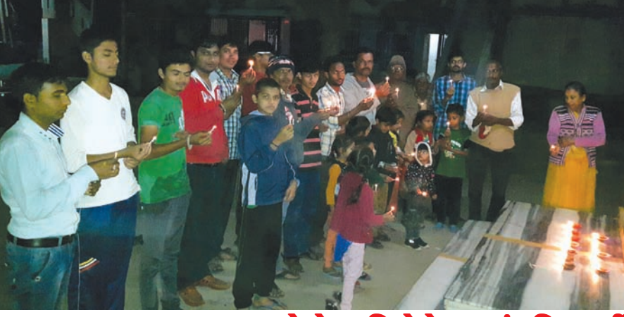
નવા મારવાડાના ભુલકાઓએ શહિદોને શ્રદ્ધાંજલિ આપી પદાણકોટના આતંકવાદી હુમલામાં શહિદી વહોરનાર ભારતીય જવાનોને અંજલી આપવા બેડબ્રહ્માના નવા મારવાડાના નાના ભુલકાઓ અને યુવકોએ મળી શહિદ જવાનોને શ્રદ્ધાસુમન અર્પણ કર્યા હતા.