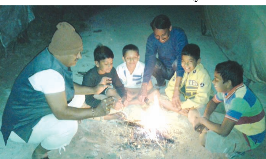
ફરીથી એકવાર ઠંડીનો ચમકારો લાગતા લોકો તપણાનો લીધો સહારો.