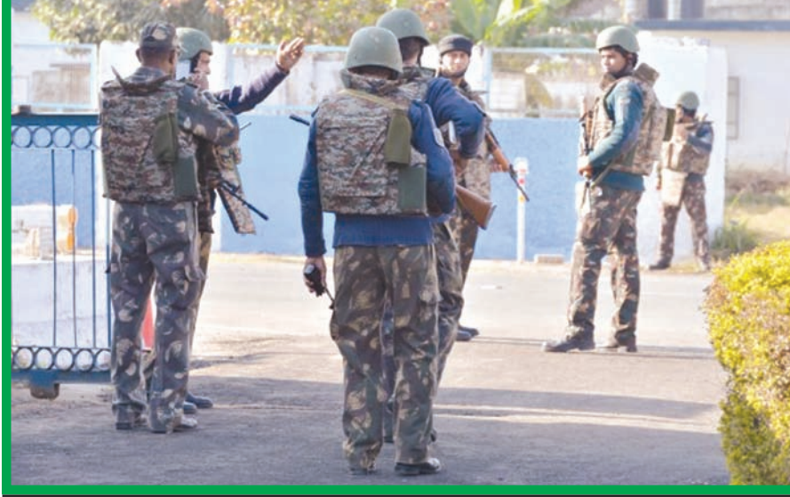
નવી દિલ્હી, તા. ૧૨ પઠાણકોટ એરફોર્સ બેઝ ખાતે કરવામાં આવેલા ભીષણ ત્રાસવાદી હુમલા મામલે તપાસને ઝડપી બનાવવા માટેની તૈયારી સરકારે કરી લીધી છે. જેના ભાગે હવે તપાસ માટે ઈન્ટરપોલની પણ મદદ લેવાશે. કેન્દ્રિય ગૃહ મંત્રાલય દ્વારા કહેવામાં આવ્યું છે કે ત્રાસવાદીઓની ઓળખ કરવાના પ્રયાસ હેટળ એક બ્લેક કોર્નર નોટીસ જારી કરવા માટે સરકાર ઈન્ટરપોલની નોટીસ જારી કરશે. કેન્દ્રિય ગૃહ મંત્રાલય દ્વારા કહેવામાં આવ્યું છે કે ત્રાસવાદી

ચાર ત્રાસવાદીઓની ઓળખ કરવા માટે બ્લેકકોર્નર નોટિસ જારી થશે : તપાસને તીવ્ર બનાવવાના હેતુસર ભારત સરકારે કમરકસી : તપાસ દરમિયાન એનઆઈએની ટીમને એક મોબાઇલ, દુર્ભિન અને એકે ૪૭ મળતા ચક્રચાર