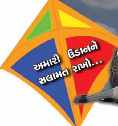
● અનુસંધાન પાન-૭ પર