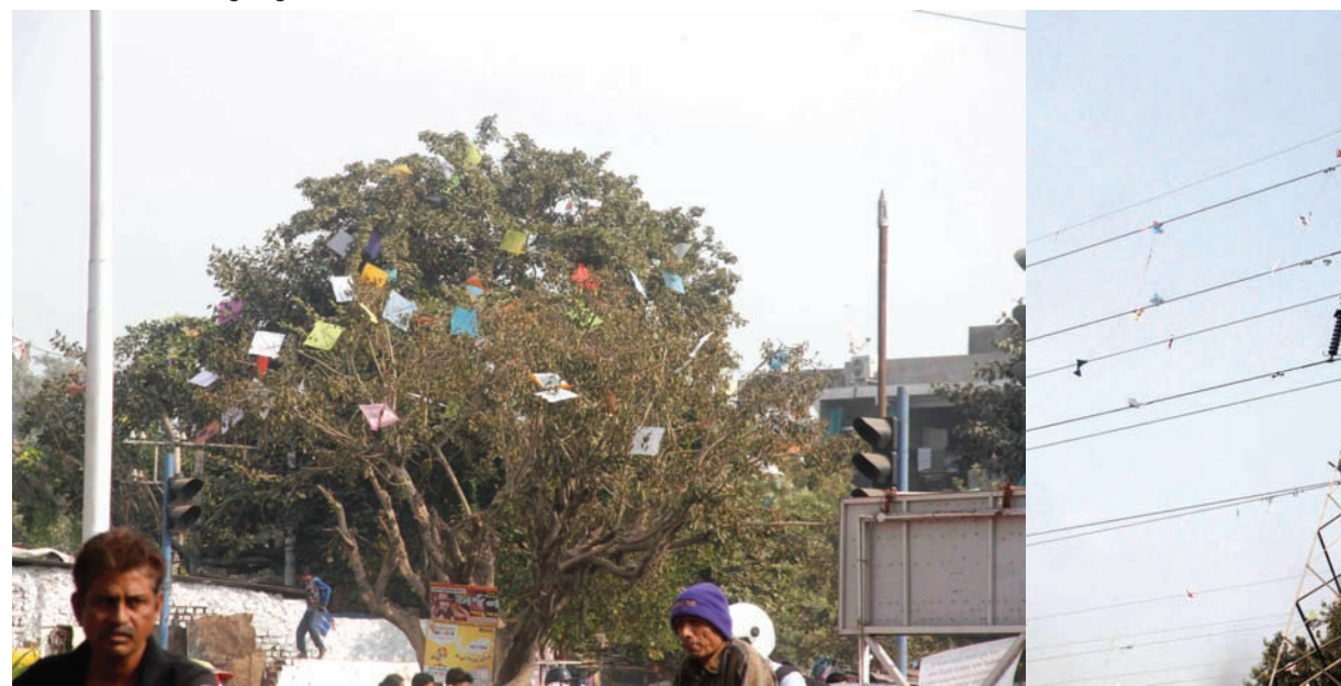
ઉત્તરાખંડની પાહોળી અસર : આજકાલ શહેર કે ગામડાના માર્ગો ઉપરથી પસાર થઈએ તો આ બન્ને દેશો આપણી આંખ સામે પ્રસ્નાર્થ બનીને ઉભા રહે છે. પતંગ ઉડાડવાની મજા અનોખી જ હોય છે. સૂર્ય ઉપાસનાનું મહાપર્વ છે. સામૂહિક જીવનના પાઠ શિખવાનું નિમિત્ત છે. ઉલ્લાસ પ્રગટાવવાનું અનોખું પર્વ છે. પરંતુ પર્યાવરણ અને પશ્ચીમનો વિચાર નહીં કરાતા સોનાની ઢાળીમાં લોહાની મેખ અનુભવાય છે. પર્યાવરણના મહત્વના અંગો વૃક્ષ અને પશ્ચીમો બન્નેને નુકસાન થતું હોય તેવા શોષ અને આનંદની અભિવ્યક્તિ સંદર્ભે પુનઃ વિચારવાની આવશ્યકતા છે. ઉલ્લાસ અને આનંદની અનિવાર્યતા છે. પરંતુ પર્યાવરણના રક્ષણની જવાબદારી પણ એટલી જ આપણા સૌના શિરે છે. આ તસવીરો આપણને આગામી ઉત્તરાખંડ સંદર્ભે કંઈક વિચારવાની પ્રેરક બને એવા આશયથી રજૂ કરાઈ છે.

ગાંધીનગર તા. ૧૬ શહેરમાં શિયાળાની ઋતુનો મિજાજ વારંવાર બદલાતા મોસમના વિચિત્ર અંદાજથી આમ શહેરીજનો પરેશાન છે. ઠંડી ગરમીની બેવડી અસરના લીધે જન આરોગ્ય પર વિપરિત અસર થવા પામી છે. છેલ્લા ૪૮ કલાકમાં ઠંડીનો પારો ૬ ડીગ્રી ઉચ્ચતામાં આજે લઘુત્તમ તાપમાન ૧૪:૨ ડીગ્રીએ પહોંચી ગયું હતું. દિવસના નગરજનો પરસેવે નીતરતી ગરમીનો અહેસાસ કરી રહ્યા છે. જ્યારે રાત્રિના સમયે ઠંડીનું મોજુ ફરિ વળતા બેવડી ઋતુ અનુભવતા નાગરિકો પણ સુસ્તીનો શિકાર બન્યા છે. હરિયાળા ગાંધીનગરમાં શિયાળાની ગુલાબી ઠંડીની મોસમ આ વર્ષે નગરજનો માટે સુસ્તીરૂપ બની હોવાનું સ્પષ્ટ થયું છે. ઠંડી ગરમીના પારાની સતત વધ ઘટના લીધે મોસમના વિચિત્ર મિજાજનો અહેસાસ નગરજનો કરી રહ્યા છે. આજે ઠંડી અને કાલે ગરમીની જેમ સતત બદલાતા વાતાવરણના લીધે શહેરજનોના આરોગ્યને પણ વિપરિત અસર થઈ રહી છે. બદલાતા રહેતા મોસમના મિજાજ વચ્ચે શહેરમાં વાઈરલ ફિવરના દર્દીઓમાં પણ સતત વધારો જોવા મળી રહ્યો છે. આક્રમક બનતી ઠંડીનો પારો અકદમ ઉચ્ચતા ગરમ કપડામાં લપેટાયેલા નગરજનોએ ઘરમાં પંખા ચાલુ કરી બેસવાનો વારો આવે છે. છેલ્લા ૪૮ કલાકમાં જ ઠંડીનો પારામાં ૬ ડીગ્રીનો ફેરફાર નોંધાયો છે. એક દિવસ અગાઉ જ લઘુત્તમ તાપમાન ૮.૫ ડીગ્રી પહોંચી જતા નગરજનો આક્રમક કોલ્ડ વેવની અસરથી પ્રભાવિત થયા હતા. જ્યારે ૪૮ કલાકમાં જ મોસમનો મિજાજ બદલાતા લઘુત્તમ તાપમાન ૧૪.૨ ડીગ્રી સુધી પહોંચી ગયું હતું. જેના લીધે શહેરીજનોએ ગરમીનો અહેસાસ કર્યો હતો. દિવસ દરમિયાન પણ તાપ આકરો બનતા શહેરીજનોને પરસેવે ભીંજાવાનો વારો આવ્યો હતો. જ્યારે મહત્તમ તાપમાન પણ ૨૮ ડીગ્રી નોંધાયું હતું. અગાઉ અસહ્ય કોલ્ડ વેવથી પ્રભાવિત શહેરીજનો ઠંડી ગરમીના અહેસાસથી સુસ્તી અને અકળામણ અનુભવી રહ્યા છે.