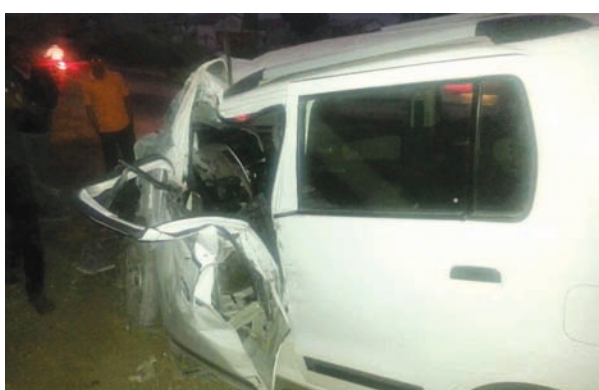
મિલોડાના મોહનપુર ગામ પાસે કાર દિવાલ સાથે ટકરાતાં એકનું મોત

રૂપાલમાં આઉટપોસ્ટની સામે જ આવેલ પોસ્ટ ઓફીસમાં ચોરી તસ્દર ટોળકીએ ત્રાટકી અંદાજે રૂ. ૫૦ હજારના મુદ્રામાલની ચોરી કરી લઈ ગયા હતા. જે અંગેની ફરિયાદ રવિવારે ગાંધી પોલીસ સ્ટેશનમાં નોંધવાઈ છે. રૂપાલ ગામે આવેલ આઉટપોસ્ટ પોલીસ સ્ટેશનમાં છેલ્લા પાંચ વર્ષથી કોઈ સ્ટાફ ફાળવવામાં આવ્યો ન હોવાને કારણે તે નબળીયાતુ છે. દરમિયાન શનિવારે રાત્રે આઉટપોસ્ટ પોલીસ સ્ટેશનની સામે આવેલ પોસ્ટ ઓફીસના દરવાજાનું તાળુ તોડી અજાણ્યા શખ્સોએ અંદર પ્રવેશ કરી તિજોરીમાં રાખેલ રૂ. ૬૧૬૮ની રોકડ ચોરી કરી લઈ ગયા હતા.