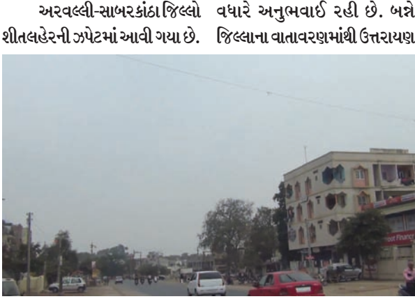
ઉત્તરીય પવનને લીધે બન્ને જિલ્લામાં ઈંડીનું જોર યથાવત રહ્યું છે. ખાસ કરીને વાદળછાયા વાતાવરણના પગલે મોડી રાત્રે વહેલી સવારે ઈંડી પર્વ પહેલા ઈંડી અચાનક ગાયબ થવાની સાથે તાપમાનના લઘુત્તમ પારામાં નોંધપાત્ર વધારો થતા પ્રજાજનો અને ખેડૂતો ગરમીનો અહેસાસ અનુભવી રહ્યા હતા. બન્ને જિલ્લાના વાતાવરણમાં મકરસંક્રાંતિ ચિંતીત બન્યા છે. સતત વાદળો જણાતા પ્રજાજનો અને ભૂમિપુત્રો વચ્ચેના વાતાવરણમાં મકરસંક્રાંતિ ચિંતીત બન્યા છે. સતત વાદળો

મોડાસા, તા. ૧૮ અપરંચેર સાકલોનીક સરક્યુલેશનની અસરથી દેશના અનેક રાજ્યોમાં વરસાદની શક્યતાની સાથે વાતાવરણમાં ભારે પલટો જોવા મળી રહ્યો છે. જેની અસર ગુજરાત રાજ્ય અને સાબરકાંઠા-અરવલ્લી જિલ્લામાં જોવા મળતા બન્ને જિલ્લાના હવામાનમાં ભારે પલટો આવવાની સાથે આકાશી વાદળો ઘેરાતા ઈંડીનો ભારે ચમકારો અનુભવાઈ રહ્યો છે.