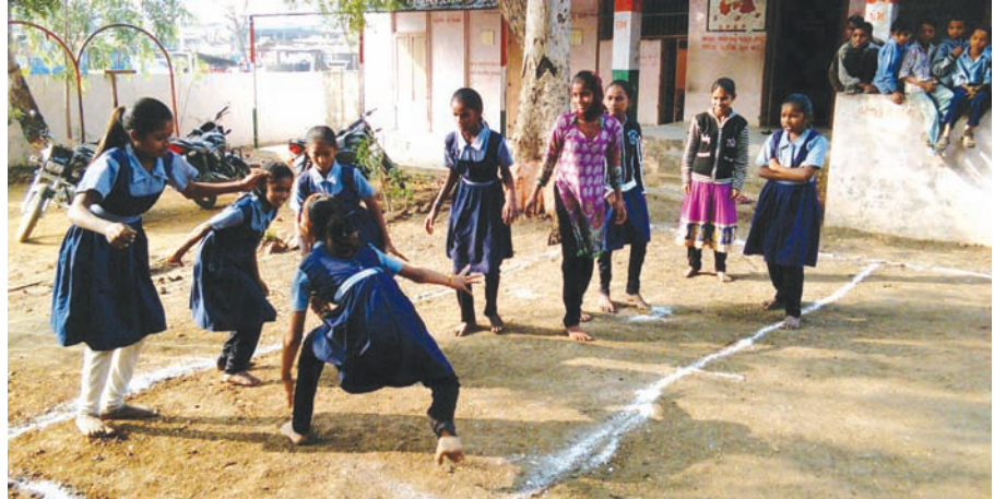
બેલ મહાકુંભ અંતર્ગત માથાસુલિયા પ્રાથમિક શાળામાં સ્પર્ધા યોજાઈ

ગાંધીનગર, તા. ૧૯ આકાશમાં સમયાંતરે ખગોળીય ઘટના બને છે. શોધાયેલા ગ્રહો અને વણશોધાયેલા ગ્રહો સૂર્યની આસપાસ પરિભ્રમણ કરે છે. અગિયાર વર્ષ બાદ આકાશમાં મંગળ, બુધ, ગુરુ, શુક્ર અને શનિ એમ પાંચ ગ્રહો તા. ૨૦મી જાન્યુઆરીથી તા. ૨૮મી ફેબ્રુઆરી સુધી એક સાથે પૂર્વ દિશામાં સૂર્યોદય પહેલા નરી આંખે જોઈ શકાશે. આકાશમાં વર્ષ ૨૦૦૪-૨૦૦૫માં એક સાથે આજે દિશામાં પાંચ ગ્રહોનો અવકાશી નજારો જોવા મળ્યો હતો. ૧૧ વર્ષ બાદ ફરીને આગવી ઓળખ છે. તેમાં ૨૮મી જાન્યુઆરીએ ચંદ્ર પાસે ગુરુ ગ્રહ, સમયેક્ષિતીએ ચંદ્ર દ્વારા મંગળ, બુધ, ગુરુ, શુક્ર અને શનિ ગ્રહોને આસાનીથી નરી આંખે જોઈ શકાશે. આકાશમાં વર્ષ ૨૦૦૪ અને ૨૦૦૫માં એક સાથે આજ દિશામાં પાંચ ગ્રહોનો અવકાશી નજારો જોવા મળ્યો હતો. ૧૧ વર્ષ બાદ ફરીને પૂર્વ દિશામાં સૂર્યોદય જોવા મળશે. આકાશમાં ગ્રહોની આગવી ઓળખ છે. તેમાં ૨૮મી જાન્યુઆરીએ ચંદ્ર પાસે ગુરુ ગ્રહ, જ્યારે પહેલી ફેબ્રુઆરીએ ચંદ્ર પાસે યુતિમાં મંગળ ગ્રહ જોવા મળશે. તા. ૮ ફેબ્રુઆરીએ ચંદ્રથી માત્ર ૧ ડિગ્રી દૂર શનિ ગ્રહ જોવા મળશે. તા. ૬ ફેબ્રુઆરીએ શુક્ર ગ્રહ આહલાદક જોવા મળશે. વિજ્ઞાનના ઉપકરણોથી વધુ સ્પષ્ટ જોઈ શકાશે. સવારે પોણા છ થી સાત આસપાસ એક કલાકના ગાળામાં પાંચે ગ્રહો પૂર્વ દિશામાં ક્ષિતિજે જોવા મળશે. જેમાં સૌથી તેજસ્વી પ્રકાશિત શુક્ર ગ્રહ જટલી ઓળખાય જાય છે. બાદ ગુરુ, શનિ, મંગળ અને બુધ ગ્રહ જોવા મળશે. બુધ ગ્રહ જોવા માટે ખગોળદષ્ટિ અતિ જરૂરી છે.