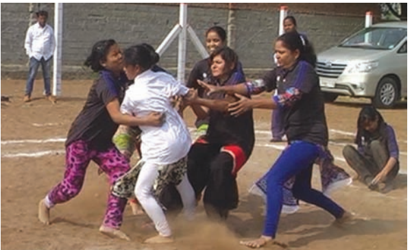
ગલતેશ્વરમાં કબડ્ડી સ્પર્ધા યોજાઈ

હિંમતનગર, તા. ૧૯ સાબરકાંઠા જિલ્લામાં સોમવારે વાતાવરણમાં આવેલા અચાનક પલટાને કારણે આખો દિવસ વાતાવરણ વાદળછાયુ રહ્યું હતું. જોકે સવારથી જ ગાઢ ધુમ્મસ પડી રહ્યું હોવાને કારણે વાતાવરણ ધૂધળુ બની રહ્યું હતું. તેમજ દિવસ દરમિયાન પણ સૂર્યદેવના દર્શન થયા ન હતા. સોમવારે વાતાવરણમાં આવેલા અચાનક પલટાને કારણે ખાસ કરીને હિંમતનગર, પ્રાંતિજ, ઈંડર, ખેડબ્રહ્મા, વડાલી, પોશીના અને વિજયનગર સહિતના અન્ય સ્થળે અંદાજે ૧૫ હજાર હેક્ટરથી વધુ જમીનમાં વાવેતર કરાયેલા દીવેલા, રાયડો, વરિયાળી, જરૂના પાકમાં રોગચાળો આવવાની સંભાવનાને લઈને ખેડૂતવર્ગ ચિંતાતુર બની ગયો છે. ઉલ્લેખનીય છે કે જે ખેડૂતોએ રાયડાનું આગોતર વાવેતર કરી દીધું છે ત્યારે તે પાક દાષ્ટા અવસ્થામાં હોવાથી મોલોમસીનો ઉપદ્રવ થવાની બીકે ખેડૂતોએ દવાઓનો છંટકાવ શરૂ કરી દીધો છે. બીજી તરફ વાતાવરણમાં આવેલા પલટાને કારણે લોકોએ દિવસ દરમિયાન ઈંડીનો વધુ અનુભવ કર્યો હતો. ખેતી વેજાનિકોના જણાવવા મુજબ આગામી ત્રણ દિવસ સુધી આકાશ વાદળછાયુ રહેનાર હોવાને કારણે માવઠાની શક્યતા નક્કી શકાતી નથી. એટલું જ નહિ પણ જિલ્લાના વિવિધ સ્થળે ખેડૂતો ઉનાળુ મગફળીનું વાવેતર કરી રહ્યા છે ત્યારે તેમના માટે પણ વાતાવરણનો આ પલટો ચિંતા સમાન બની ગયો છે. જોકે ઈંડી વધુ પડશે તો ઘઉંના પાકને ફાયદો થશે.