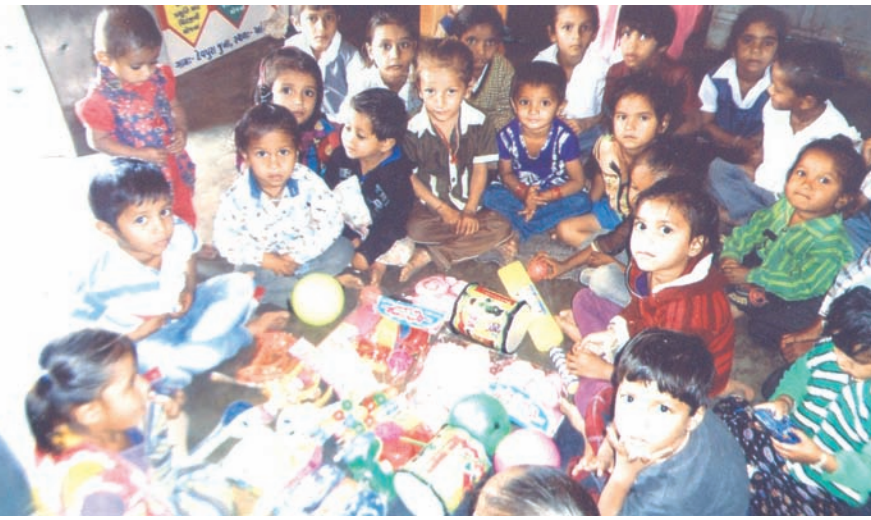
ગાંધીનગરના સૌરાષ્ટ્ર કચ્છ સમાજ સેવાની મહિલા પોંખ દ્વારા ભોરીજ ગામની આંગણવાડીના જરૂરિયાતમંદ બાળકો માટે રમકડાં દાનમાં આપવામાં આવ્યા હતા કુલ રૂપિયા પાંચ હજારના રમકડા દાન આપી સૌરાષ્ટ્ર કચ્છ સમાજ સેવાની મહિલાઓએ ઉન્નત્ક સેવા કાર્યનું ઉદાહરણ પ્રસ્તુત કર્યું છે. રમકડાં જોઈ આંગણવાડીના બાળકોના ચહેરા પર ખુશ વ્યાપી જવા પામી હતી.