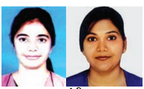
ગાંધીનગર, તા. ૨૧

અશ્વિનભાઈ એ પટેલ કોમર્સ કોલેજના એનએસએસ યુનિટની સ્વયંસેવક બે વિદ્યાર્થીનીઓની પસંદગી રાજ્ય એવોર્ડ માટે કરવામાં આવી છે.