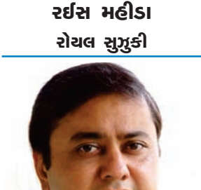
રર્ષસ મહીડા રોયલ સુઝુકી