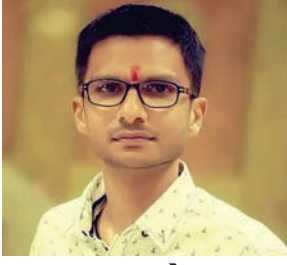
તાપન શેઠ પેઈન્ટર