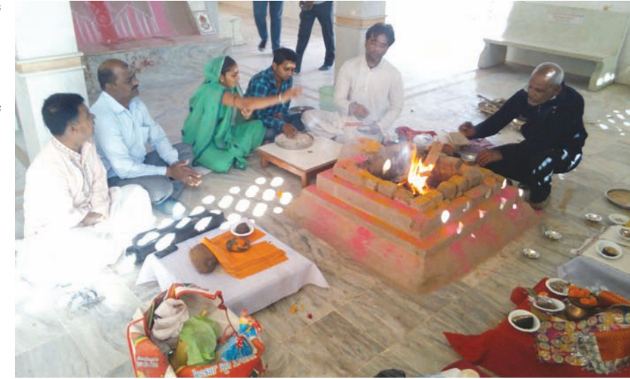
પ્રજાપતિ સ્થાયી પરિવારના ઈષ્ટદેવ ભગવાન શ્રી પદ્મનાભજીના મંદિર પરિસરમાં બિરાજમાન શ્રી અંબાજી માતાજીના સનમુખ આજરોજ માતાજીના પાટોસવ દિવસની ભક્તિમય માહોલમાં ઉજવણી કરવામાં આવી હતી. આ ધાર્મિક પ્રસંગને લઈ શક્તિયજ્ઞનું પણ આયોજન કરવામાં આવેલ જેનો મોટી સંખ્યામાં ભાવિકભક્તોએ ઉપસ્થિત રહી દર્શન પ્રસાદનો લાભ લીધો હતો. માતાજીના પ્રાગટ્ય પર્વને યાદગાર બનાવવા પાટણ પ્રજાપતિ એકતા મંચના યુવા કાર્યકરોએ ભારે જહેમત ઉઠાવી હતી.

● અનુસંધાન છેલ્લાનું ચાલુ ચૂંટણી પંચની સ્થાપના ૨૫મી