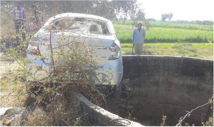
દાંદોઈ-કૂલા રોક પરથી ફોર્ડ-ફીગો કાર પલટી, ૨૫૦ ફૂટ દૂર કૂવા પર લટકી