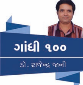
ગાંધી ૧૦૦ ડો. રાજેન્દ્ર જાની

તેઓનાં વચનો શાસ્ત્રપ્રમાણ જેવા ગણી હિંદુ સંસાર-ઝીલી લેશે, અને સ્મૃતિ આદિમાં રહેલા કટાક્ષોથી આપણે લાજશું. અને તેને ભૂલી જઈશું. ગાંધી કોઈ પણ વિષય ઉપર જ્યારે જરૂર પડી ત્યારે બોલ્યા છે. કોઈ પણ બાબત ઉપર જાહેર ચર્ચા કરવામાંથી પોતાની જાત કે પોતાની વાતને તેમણે છેડી રાખી નથી. સ્ત્રીઓના માસિક ધર્મ વિશે તેમણે કહ્યું છે 'જુતુ પ્રાપ્તિએ એ સ્ત્રીઓને સારું માસિક વ્યાધિ છે. એ વખતે દરદીને અત્યંત શાંતિની આવશ્યકતા છે. માસિક ધર્મને વખતે કોઈ નિયત કાર્ય ન સોંપાય એમ મને લાગે છે ખરું. ક્યારે સ્ત્રીને આ સમયમાં દુઃખ જણાય તે તેના વગર કોઈ કપી ન શકે. આ સમયમાં સ્ત્રીની ઉપર કશા પ્રકારનો બોજ ન હોય એ ઈષ્ટ છે. આ સમયગાળામાં સ્ત્રીને જવાબદારી માત્રમાંથી મુક્ત રાખવી ઘટે છે. તેને સૂઈ રહેવું હોય તો સુવાની ટેવ હોવી જોઈએ. અણસમજથી કેટલીક સ્ત્રીઓ તે સમયમાં પણ દોડધામ છોડતી નથી તે જ્ઞાનહીન છે. તેને સમજ આપવાની જરૂર છે. બેઠાં બેઠાં અથવા અલ્પ પ્રયાસથી થઈ શકે એવા અનેક પ્રકારના ધરકામ તેઓ માટે કલ્પી શકાય છે કે જે રજસ્વલા સ્ત્રી સુખેથી કરી શકે. ગાંધીજી કહે છે માસિક ધર્મનું સંપૂર્ણ જ્ઞાન તે ઉંમરે પહોંચેલી બાળાને આપવું, તેથી નાની બાળા તે જાણે ને પૂછે તો તેને પણ તે સમજ શકે તેટલું સમજાવવાય. સંદર્ભ : સ્ત્રીઓ અને સ્ત્રી જીવનની સમસ્યાઓ, ગાંધીજી, સંપાદક : લલ્લુભાઈ મકનજી, નવજીવન પ્રકાશન મંદિર, અમદાવાદ-૩૮૦૦૧૪ (લેખક ગુજરાત કોલેજ, અમદાવાદ ખાતે સમાજશાસ્ત્રના અધ્યાપક છે.)