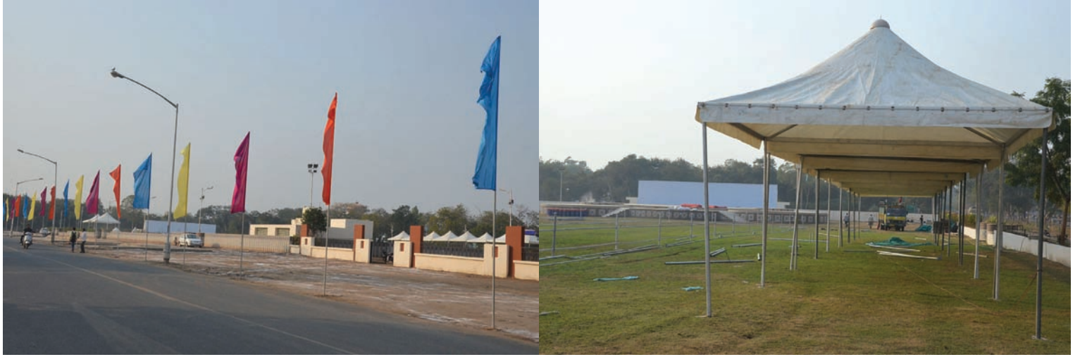
હાફ મેરેથોન - શહેરમાં પ્રથમવખત યોજાઈ રહેલ હાફ મેરેથોન સંદર્ભે ભારે ઉત્તેજના વર્તાય છે... પ્રસ્થાન કેન્દ્ર ધ-પ ઓપન એર થિયેટર ખાતે તડામાર તૈયારીઓ ચાલી રહી છે... અંદાજે ૨૫૦૦ દોડવીરો હાફ મેરેથોનમાં ભાગ લેશે...

પુર્ણરૂપે ઉપલબ્ધ થઈ શકી નથી. જેના લીધે શહેરી વિસ્તારના ગ્રામજનોમાં પ્રબળ આકોશ છવાયો છે. ઈન્દ્રોડા ગામમાં પણ છેલ્લા ઘણાં સમયથી પાણીની પોકાર ઉઠવા પામી નથી. ગામના રબારી તેમજ રાવળવાસમાં પાણી ન આવતા રહીશો ત્રાહીમામ દ્વારા આગામી ચુંટણીનો પણ બહિષ્કાર કરવામાં આવશે. શહેરી વિસ્તારમાં સમાવિષ્ટ ગામોમાં છેલ્લા ઘણાં સમયથી પાણીની પોકાર ઉઠવા પામી છે. ગામોમાં પાણી ગટર તેમજ રસ્તાઓની કામગીરી પણ પુર્ણ થઈ નથી. જ્યારે નવા