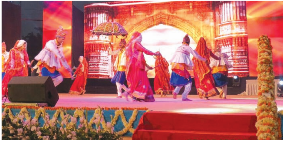
શહેરની સૌથી જૂની કલાસંસ્થા વેણુ ભારતીના કલાકારો દ્વારા કાંકરિયા કાર્નિવલ ખાતે રાસ, ગરબા, ટીપ્પણી, લાવણી જેવાં લોકનૃત્યો રજૂ કરી પ્રેક્ષકોની ભરપૂર દાદ મેળવી હતી.