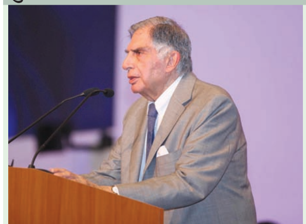
ગાંધીનગર, તા. ૧૦

ગુજરાતમાં રોકાણ ન કરે તે મૂર્ખ છે : રતન તાતા વડાપ્રધાન મોદીની દૂરદર્શિતાની તાતા ગ્રુપના ચેરમેન દ્વારા વાઈબ્રન્ટમાં પ્રશંસા