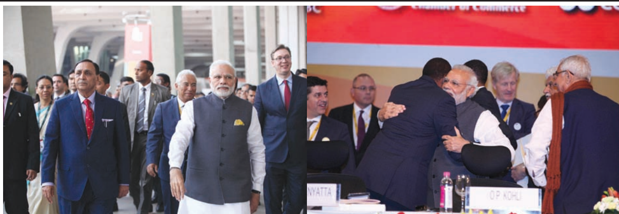
વાઈબ્રન્ટ સમિટની યાદગાર તસવીરો - ગાંધીનગર મહાત્મા મંદિર ખાતે મંગળવારે આરંભાયેલ વાઈબ્રન્ટ સમિટની તસવીરો યાદગાર બની રહેશે... પ્રધાનમંત્રી અને મુખ્યમંત્રીનો શાનદાર પ્રવેશ... પોલેન્ડના પ્રધાનમંત્રીને ભેટતા નરેન્દ્રભાઈ મોદી અને આવજો... જોવા ભાવસભર શબ્દો સાથે લાક્ષણિક પ્રવચનની પૂર્ણાહુતિ યાદ રહેશે...