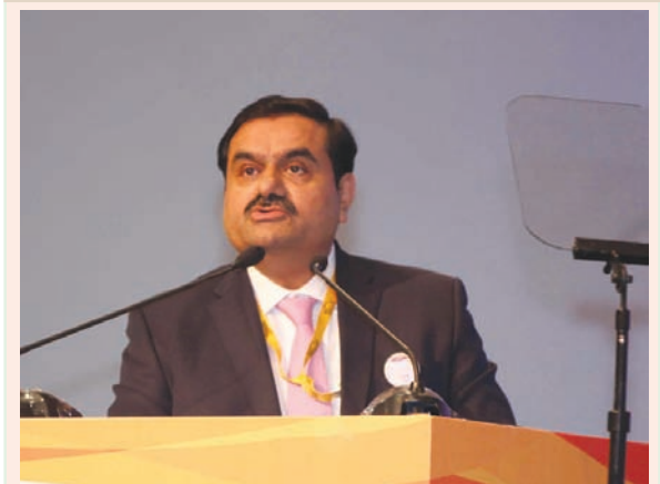
ગાંધીનગર, તા. ૧૦

ગુજરાતમાં ૪૮૦૦૦ કરોડનું અદાણી ગ્રુપ મૂડીરોકાણ કરશે છેલ્લા પાંચ વર્ષમાં ૪૮૦૦૦ કરોડ રોકાયા : ગુજરાતમાં ૨૫૦૦૦ લોકોને અદાણી ગ્રુપ દ્વારા નોકરી અપાઈ છે : ગુજરાત મારી કર્મભૂમિ : ગૌતમ અદાણી