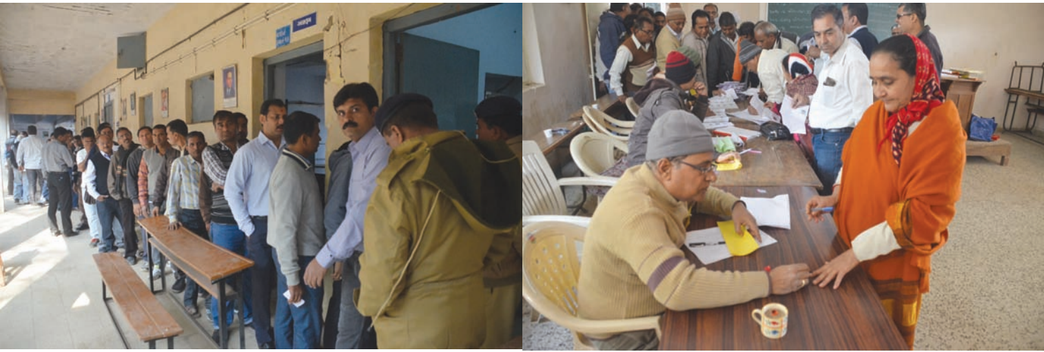
માધ્યમિક શિક્ષણ બોર્ડ માટે મતદાન - ગુજરાત રાજ્ય માધ્યમિક શિક્ષણ બોર્ડની ૧૮ બેઠકો માટે યોજાયેલી ચૂંટણી માટે શુક્રવારે રાજ્યભરમાં મતદાન યોજાયું હતું... ગાંધીનગર ખાતે પણ ઉભા કરાયેલા બે મતદાન મથકો પર જિલ્લાના આચાર્યો - શિક્ષકો અને સંચાલકોએ મોટી સંખ્યામાં મતદાન કર્યું હતું.