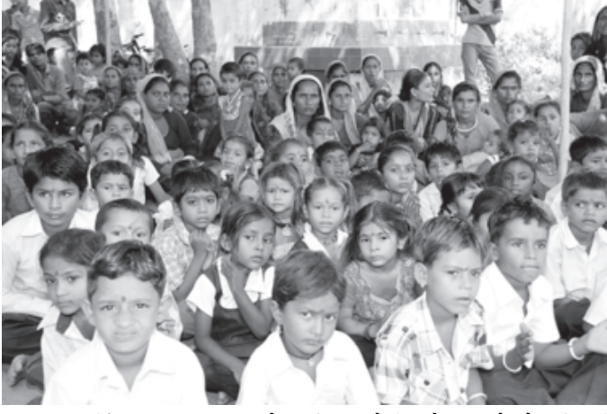
ગાંધીનગર, તા. ૩૦ કન્યા કેળવણી અને શાળા પ્રવેશોત્સવ શહેરી વિસ્તારના બીજા તબક્કામાં દહેગામ નગરપાલિકા વિસ્તારના ગણેશપુરા, બારીયાના છાપરા અને લક્ષ્મીપુરા ગામોમાં આજે શાળા પ્રવેશોત્સવ ઉત્સાહભેર ઉજવાયો હતો.

ગણેશપુરા ગામમાં લોકમનોરંજન કરનારા મદારી-ગારૂડીના ભૂલકાઓનું ઉમંગભેર ધોરણ ૧ માં નામાંકન કરાયું