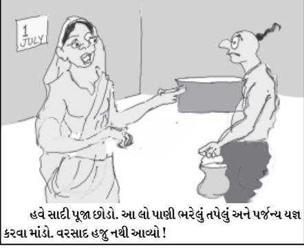
હવે સાદી પૂજા છોડો. આ લો પાણી ભરેલું તપેલું અને પર્જન્ય યજ્ઞ કરવા માંડો. વરસાદ હજુ નથી આવ્યો!