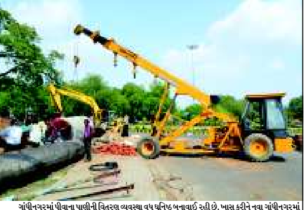
ગાંધીનગરમાં પીવાના પાણીની વિતરણ વ્યવસ્થા વધુ ઘનિષ્ઠ બનાવવાઈ રહી છે. ખાસ કરીને નવા ગાંધીનગરમાં સરિતા ઉદ્યાન અને સેક્ટર-૫ની પાણીની ટાંકી દ્વારા નવા સેક્ટરોમાં પાણીનો પુરવઠો વધુ દબાણથી અપાય તેવા આયોજનના ભાગરૂપે વિશાળ પાણીની પાઈપલાઈનો નંખાઈ રહી છે. ધ-૩ સર્કલ પાસે પાઈપ લાઈન નાંખવાનું કામ પૂરજોશમાં ચાલી રહ્યું છે. (તસવીર : દિપક જાની)