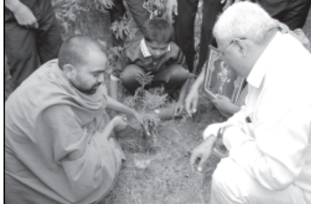
ગાંધીનગરના ધોળાકુવા રોડ પાસે આવેલી સ્વામીનારાયણ ધામ ઈન્ટરનેશનલ સ્કૂલમાં ગુરૂવંદનાનો કાર્યક્રમ યોજવામાં આવ્યો હતો. જેમાં વિદ્યાર્થીઓ દ્વારા સંતો અને ગુરૂને વંદન કરી વૃક્ષારોપણ કાર્યક્રમ યોજવામાં આવ્યો હતો. શાળાના આચાર્યએ આપેલી માહિતી મુજબ ગત રોજ શાળાના પટાંગણમાં વિદ્યાર્થીઓ દ્વારા રંગોળી, હરિકાઈ અને ચિત્ર સ્પર્ધાનું ગુરૂ પૂર્ણિમાના પૂર્વ દિને આયોજન કરવામાં આવ્યું હતું. વિદ્યાર્થીઓને પૂ. સંતો દ્વારા આશીર્વાચન આપવામાં આવ્યા હતા. પૂ. સંતોના પૂજનનો કાર્યક્રમ રાખવામાં આવ્યો હતો. ગુરૂવંદના કાર્યક્રમમાં પૂ. સંતો, શિક્ષકો અને વિદ્યાર્થીઓ દ્વારા વૃક્ષારોપણ કરવામાં આવ્યું હતું. વિદ્યાર્થીઓ દ્વારા યોજાયેલી રંગોળી સ્પર્ધા અને ચિત્ર સ્પર્ધામાં દરેક વિદ્યાર્થીએ રસપૂર્વક ભાગ લીધો હતો અને કાર્યક્રમ સફળ બનાવ્યો હતો.

ગાંધીનગર તા. ૨ કેટલીક વખતે પોતાની ભૂલ પોતાને દેખાતી નથી. તેવો કિસ્સા બનતા હોય છે. ઘ-૫ ટ્રાફિક પોલીસની આ પ્રકારની હેરાનગતિ લોકોને થતી હોય છે. શનિવારે એક શિક્ષિત ગ્રામ્ય યુવાન પોતાનું વાહન લઈને ઘ-૫ બાજુ જઈ રહ્યો હતો. ત્યારે ઘ-૫ આગળથી પસાર થતાં ટ્રાફિક પોલીસે અટકાવીને ગાડીની નંબર પ્લેટમાં ખામી છે. તે દર્શાવીને મેમો આપવાની કાર્યવાહી શરૂ કરી હતી. પરંતુ તે ટ્રાફિક પોલીસ યુનિટના વાહનોમાં ફેન્સી પ્લેટ વાળા હતા. જેથી યુવાને રજૂઆત કરી કે સામે વાહન છે તેને પણ ફેન્સી પ્લેટ છે. તો આ વાહન સામે કેમ મેમો ઈસ્યુ થતો નથી. મારા સામે જ મેમો બનાવવાનું