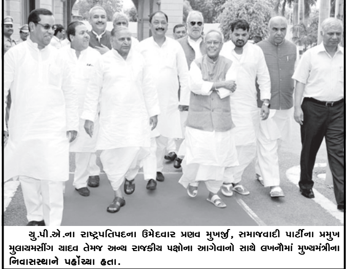
યુ.પી.એ.ના રાષ્ટ્રપતિપદના ઉમેદવાર પ્રણવ મુખર્જી, સમાજવાદી પાર્ટીના પ્રમુખ મુલાયમસીંઘ યાદવ તેમજ અન્ય રાજકીય પક્ષોના આગેવાનો સાથે લખનૌમાં મુખ્યમંત્રીના નિવાસસ્થાને પહોંચ્યા હતા.

જેથી હજારો લોકોને ભારે મુશ્કેલી મળી છે. વરસાદને કારણે ઘણી જગ્યાએ વૃક્ષો ધરાશાયી થઈ ગયા છે. પાણી પણ ભરાઈ ગયા છે. બેસ્ટ અને રેલવે ઈન્ફ્રાસ્ટ્રક્ચરના સુત્રોના જણાવ્યા મુજબ ધારાવી, માહીમ, દાદર, પારેલ, વડાલામાં પાણી ભરાઈ ગયા છે. આ ઉપરાંત બાંદ્રા, ખાર, સાન્તાક્રુઝમાં પણ વિજળીની સમસ્યા સર્જાઈ છે. ઘણી જગ્યાએ અડધો કલાક વીજકાપની સ્થિતિ રહી હતી. સુત્રોના જણાવ્યા મુજબ બાંદ્રા, ખાર, સાન્તાક્રુઝ, વિખરોલીમાં અડધો કલાક સુધી લોકોને અંધારપટ હેઠળ રહેવાની ફરજ પડી હતી. મુંબઈમાં હજુ વધારે ભારે વરસાદ પડવાની આગવી હોવીથી તંત્ર સામે નવા પડકાર ઉભા થયા છે. ભારે વરસાદના કારણે મુંબઈમાં પાવર લાઈનો ઠપ થઈ ગઈ છે. ભારે અંધારપટની સ્થિતિ સર્જાઈ છે.