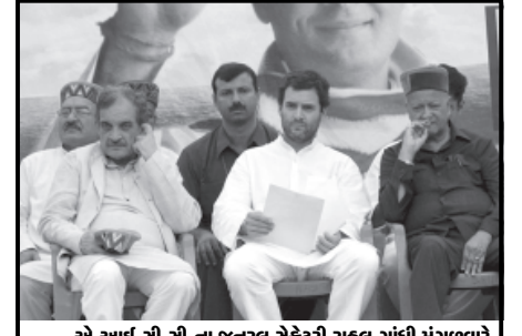
એ.આર્.સી.સી.ના જનરલ સેક્રેટરી રાહુલ ગાંધી મંગળવારે કુટુંબ ખાતે પબ્લીક રેલીમાં ઉપસ્થિત રહ્યા હતા.

૧.૫૮ ટકાનો વધારો થયો હતો. જેથી કંપની ટોચના સ્થાને પહોંચી ગઈ હતી. આની સરખામણીમાં કારોબાર દરમિયાન ટીસીએસના શેરમાં ૧.૬૧ ટકાનો ઘટાડો થયો હતો. વિસ્ટેડ કંપનીઓની માર્કેટ મુદીના આંકડા સતત ઉથલપાથલ થતા રહે છે. રિલાયન્સ ઈન્ડસ્ટ્રીની માર્કેટ મુદી ૨.૪૦ લાખ કરોડ થઈ છે અને તે ત્રીજા સ્થાન ઉપર છે. જ્યારે કોલઈન્ડિયાની માર્કેટ મુદી ૨.૨૪ લાખ કરોડ છે.