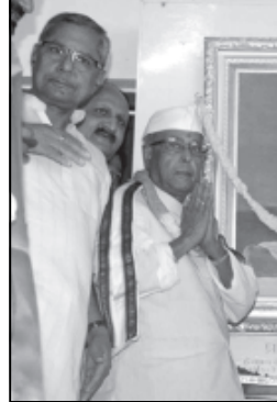
ગુજરાતમાંથી રાજ્યસભામાં ચૂંટાઈને નાણામંત્રી બન્યો હતો. ગુજરાત સાથેનો મારો નાતો અતૂટ છે.

રાજકીય કાર્યકાળ દરમિયાન મેં કેન્દ્ર સરકાર, પાલમિન્ટ કે પક્ષ વતી પત્રકારોને સંબોધન કર્યું છે. આજે હું મારા પોતાના સમર્થન માટે હું અહીં આવીને તમને સંબોધી રહ્યો છું. ૧૯૮૦ના દાયકામાં પ્રણવ મુખરજીએ જણાવ્યું હતું કે, વિદેશમાં રાષ્ટ્રપતિની ચૂંટણીમાં ટી.વી. ડીબેટ થાય છે કારણ કે ત્યાં લોકો દ્વારા રાષ્ટ્રપતિને ચૂંટવામાં આવે છે. રાષ્ટ્રપતિ દેશની પોલીસી ઘડવામાં મેકર હોય છે.