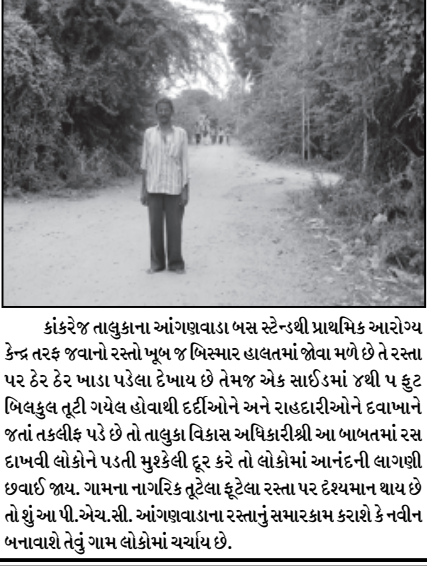
કાંકરેજ તાલુકાના આંગણવાડા બસ સ્ટેન્ડથી પ્રાથમિક આરોગ્ય કેન્દ્ર તરફ જવાનો રસ્તો ખૂબ જ બિસ્માર હાલતમાં જોવા મળે છે તે રસ્તા પર ઠેર ઠેર ખાડા પડેલા દેખાય છે તેમજ એક સાઈડમાં ૪થી ૫ ફુટ બિલકુલ તૂટી ગયેલ હોવાથી દર્દીઓને અને રાહદારીઓને દવાખાને જતાં તકલીફ પડે છે તો તાલુકા વિકાસ અધિકારીશ્રી આ બાબતમાં રસ દાખવી લોકોને પડતી મુશ્કેલી દૂર કરે તો લોકોમાં આનંદની લાગણી છવાઈ જાય. ગામના નાગરિક તૂટેલા ફૂટેલા રસ્તા પર દેશ્યમાન થાય છે તો શું આ પી.એચ.સી. આંગણવાડાના રસ્તાનું સમારકામ કરાશે કે નહીન બનાવશે તેવું ગામ લોકોમાં ચર્ચાય છે.