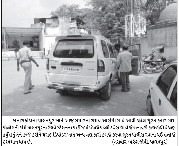
બનાસકાંઠાના પાલનપુર ખાતે આજે બપોરના સમયે આરોપી સાથે આવી ચઢેલ સુરત કતાર ગામ પોલીસની ટીમે પાલનપુરના રેલવે સ્ટેશનના પાકીંગમાં પંધાથે પડેલી ટ્રેવેરા ગાડી જે બનાવટી કાગળોથી વેચાણ કર્યું હતું તેને કબ્જે કરીને થરાદ-દિયોદર ખાતે અન્ય ત્રણ કારો કબજે કરવા સુરત પોલીસ રવાના થઈ હતી જે દેશ્યમાન થાય છે.

ઉબરી-કંબોઈની વચ્ચે બનાસ નદીના પૂલ ઉપર પડેલરા મોટા ગાબડા ક્યારે પૂરાશે? નાના મોટા વાહનચાલકો હેરાન-પરેશાન થઈ રહ્યા છે છતાં તંત્ર દ્વારા કોઈપણ જાતની તપાસ કે રીપેરીંગ કરવામાં આવતું નથી. લોકોમાં ચર્ચાનો વિષય બન્યો. બનાસ નદીનો પૂલ રત્નીંગ કરતા સાધનો ખાડામાં પછડાતાં જ બંધ થઈ જાય છે અકસ્માતનો ભય રહે છે. જવાબદાર કોણ?