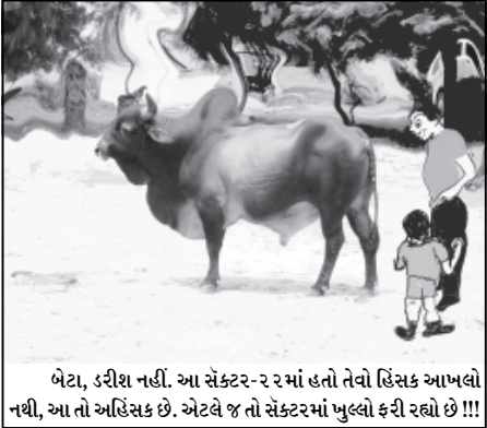
બેટા, ડરીશ નહીં. આ સેક્ટર-૨૨ માં હતો તેવો હિંસક આખલો નથી, આ તો અહિંસક છે. એટલે જ તો સેક્ટરમાં ખુલ્લો ફરી રહ્યો છે !!!