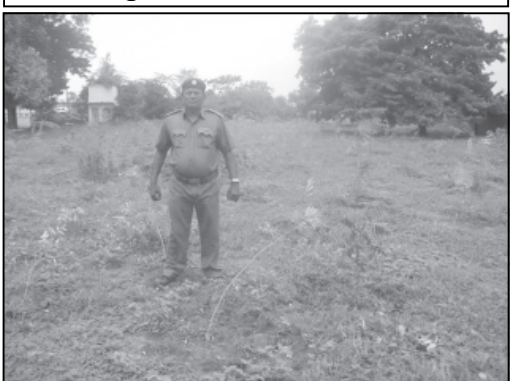
હાલમાં ગુજરાત રાજ્યમાં વપરાણી માટે સો નાગરિકો ચાતક પશીની જેમ આતુરતાપૂર્વક રાહ જોતાં આકાશ તરફ મીટ માંડીને બેઠા છે. જુલાઈના બીજા સપ્તાહમાં છૂટા છવાયા ઝરમર અને અમુક સ્થળે ઝાપટાં રૂપે મેઘમહેર થતાં પણ મન મુકીને વરસાતો નથી ત્યારે ખેડૂતો મહામુલો કપાસ, શાકભાજી, લીલો ઘાસચણાં મોંઘાં બોલેલો કોળિયો ઝૂંટવાઈ ન જાય તે અર્થે બેડ-ખાતર-પાણી દ્વારા અથાક પ્રયત્નો કરી રહ્યા છે. જ્યારે પર્યાવરણવાદીઓ 'વૃક્ષ વાલો-વરસાદ લાવો' સુરને ચરિતાર્થ કરવા વૃક્ષારોપણ તથા વનીકરણ કાર્યક્રમો દ્વારા રોપાનું વાવેતર અભિયાન ચલાવી રહ્યા છે. આવો એક કાર્યક્રમ ઓરાણા હાઈસ્કૂલના વિશાળ જગ્યાએ વનવિભાગ દ્વારા કુલ ૧૧૧૧ રોપાનું વાવેતર કરી વૃક્ષારોપણ કર્યું હતું. હાલમાં છૂટાછવાયા વરસાદમાં લીમડા, ગુલમહોદર, વડ, બદામ, જેવા અનેક રોપાઓની માવજત અને જતન કરવા શાળા પરિવાર તથા વિદ્યાર્થીઓ પાણીનું સિંચન કરી વૃક્ષ પ્રેમની ભાવના વ્યક્ત કરી રહ્યા છે.