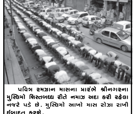
પવિત્ર રમઝાન માસના પ્રારંભે શ્રીલગરના મુસ્લિમો શિસ્તભદ્ર રીતે નમાઝ અદા કરી રહેલા નજરે પડે છે. મુસ્લિમો આખો માસ રોઝા રાખી ઈબાદત કરશે.