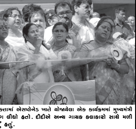
શહીદ દિન નિમિત્તે કોલકતામાં એસએલવેડ ખાતે યોજાતા એક કાર્યક્રમમાં મુખ્યમંત્રી સુશી મહા બેનરજીએ ભાગ લીધો હતો. દીદીએ અન્ય ગાયક કલાકારો સાથે મળી દેશભક્ત ગીત પણ લલકાર્યું હતું.

કોર્ટે બાલકૃષ્ણની જામીન અરજીને આખરે ફગાવી દેહરાદૂન, તા. ૨૧ સીબીઆઈ કોર્ટે યોગપુર બાબા રામદેવનાં નજીકનાં સાથી બાલકૃષ્ણની જામીન અરજી ફગાવી દીધી હતી. બિનજામીનપાત્ર ચોરેટ તેમની સામે કોર્ટ દ્વારા જાહેર કરવામાં આવ્યા બાદ સીબીઆઈએ ચોરકાલે બાલકૃષ્ણની ધરપકડ કરી હતી. બનાવટી દસ્તાવેજોનાં કેસમાં બાલકૃષ્ણની ધરપકડ થઈ હતી. ૮ ઓગસ્ટથી ભસ્ત્રવાર અને કળાના ધારા મામલે બાબા રામદેવ આંદોલન શરૂ કરનાર છે. રાષ્ટ્રીય પાટનગરમાં રામલીલા મેદાનમાં આંદોલન શરૂ થનાર છે. ૧૦ જુલાઈએ એજન્સીઓ કથિત બનાવટની રજૂઆત સાથે સંબંધિત કેસમાં બાલકૃષ્ણ સામે કેસ દાખલ કર્યો હતો. ભારતીય પાસપોર્ટ મેળવવા બીગેસ દસ્તાવેજોનો ઉપયોગ કરાયો હતો. એવી ફરિયાદ પણ છે કે આરોપીએ ભારતીય પાસપોર્ટ મેળવવા ખોટી તરકીબ આજમાવી હતી.