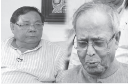
નવીદિલ્હી, તા. ૨૧ યુપીએનાં ઉમેદવાર પ્રણવ મુખર્જી આવતીકાલે ભારતનાં ૧૪મા રાષ્ટ્રપતિ બનવા જઈ રહ્યા છે. આવતીકાલે રાષ્ટ્રપતિની ચૂંટણી યોજાયા બાદ મતગણતરી હાથ