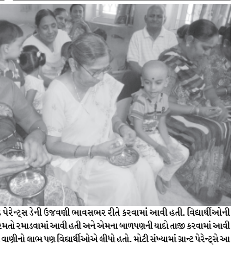
રંગેલી પ્રિ સ્કૂલ દ્વારા ગ્રાન્ડ પેરે-ન્ટ્સ ડેની ઉજવણી ભાવસભર રીતે કરવામાં આવી હતી. વિદ્યાર્થીઓની હાજરીમાં ગ્રાન્ડ પેરે-ન્ટ્સને વિવિધ રમતો રમાડવામાં આવી હતી અને એમના બાળપણની યાદો તાજી કરવામાં આવી હતી. ગ્રાન્ડપેરે-ન્ટ્સના અનુભવોની વાણીનો લાભ પણ વિદ્યાર્થીઓએ લીધો હતો. મોટી સંખ્યામાં ગ્રાન્ડ પેરે-ન્ટ્સે આ ઈવેન્ટમાં ભાગ લીધો હતો.

આજે જ્યારે ઓલિમ્પિકની ગુજરાતની ટીમમાં ગુજરાતના એક પણ ખેલાડી જોવા મળતા નથી ત્યારે આપણે ભૂતકાળને વાગોળવો જ રહ્યો.