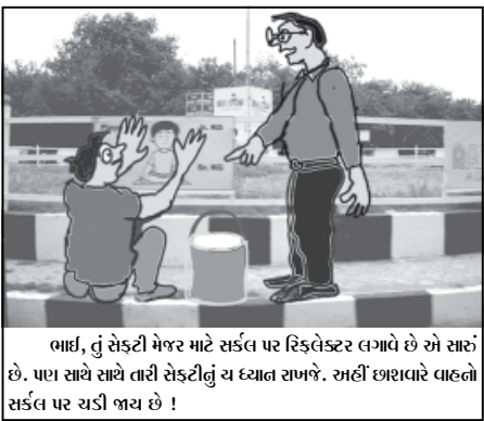
ભાઈ, તું સેડટી મેજર માટે સર્કલ પર રિક્લેક્ટર લગાવે છે એ સારું છે. પણ સાથે સાથે તારી સેડટીનું જ દયાન સમજે. અહીં છાશવારે વાહનો સર્કલ પર ચડી જાય છે !