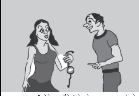
સરકાર જાણતીઓને સાકારીતિ ઇલેવેટમેન્ટલાવવાના પ્રયત્નો કરે છે તે તું ચાલતીજ રાખડી ખરીદી લાવી !!