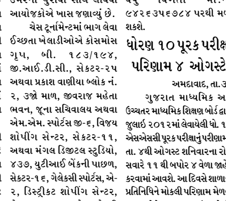
ગાંધીનગર રોટરી ક્લબ ઓફ ગાંધીનગર તથા એમ.એમ. સ્પોર્ટ્સ દ્વારા ગાંધીનગરની જનતા માટે ચેસ ટૂર્નામેન્ટનું આયોજન તા. ૧૨મી ઓગસ્ટ ૨૦૧૨ને રવિવારે જૂના સચિવાલય કેન્ટીન ખાતે કરવામાં આવ્યું છે. ૨૨૨ ધરાવતા ખેલાડીઓએ નિયત સમયમાં જરૂરી ફી ભરી પોતાનું ફોર્મ જમા કરાવવાનું રહેશે.

ગાંધીનગર, તા. ૩૦ રોટરી ક્લબ ઓફ ગાંધીનગર તથા એમ.એમ. સ્પોર્ટ્સ દ્વારા ગાંધીનગરની જનતા માટે ચેસ ટૂર્નામેન્ટનું આયોજન તા. ૧૨મી ઓગસ્ટ ૨૦૧૨ને રવિવારે જૂના સચિવાલય કેન્ટીન ખાતે કરવામાં આવ્યું છે. ૨૨૨ ધરાવતા ખેલાડીઓએ નિયત સમયમાં જરૂરી ફી ભરી પોતાનું ફોર્મ જમા કરાવવાનું રહેશે.