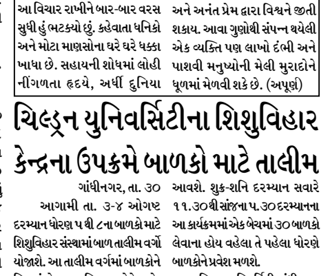
ચિલ્ડ્રન યુનિવર્સિટીના શિશુવિહાર કેન્દ્રના ઉપક્રમે બાળકો માટે તાલીમ આપવામાં આવશે. શુક્ર-શનિ દરમ્યાન સવારે ૧૧.૩૦ થી સાંજ ૫.૩૦ દરમ્યાનના આ કાર્યક્રમમાં એક બેચમાં ૩૦ બાળકો લેવાના હોય વહેલા તે પહેલા ધોરણ બાળકોને પ્રવેશ મળશે.

ગાંધીનગર, તા. ૩૦ આગામી તા. ૩-૪ ઓગસ્ટ દરમ્યાન ધોરણ ૫ થી ૮ના બાળકો માટે શિશુવિહાર સંસ્થામાં બાળ તાલીમ વર્ગો યોજાશે. આ તાલીમ વર્ગમાં બાળકોને નિષ્ણાંતો દ્વારા ચિત્ર, ઓરંગનો, બાળગીતો, સંગીત, યોગ, ક્રિયા એઈમની તાલીમ આપવામાં આવશે. આ તાલીમ વર્ગો માટેની સભ્યતા ફી રૂ. ૨૦૦ છે. આ તાલીમ વર્ગો માટેની સભ્યતા ફી રૂ. ૨૦૦ છે. આ તાલીમ વર્ગો માટેની સભ્યતા ફી રૂ. ૨૦૦ છે.