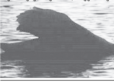
પુષ્પની મધુ પામવા માટેની પાત્રતા માત્ર પતંગિયાં પાસે જ હોય છે. માણસ ગુલાબમાંથી ગુલાબકંદ, ગુલાબજળ કે અત્તર બનાવી શકે પરંતુ મધ ન પામી શકે. ધરતીમાંથી ઘણું બધું ઉછેરે પરંતુ ભગવાનને થયું લાવને કવિતા ઉગાડું. અને તેણે પુષ્પનું સર્જન કર્યું. લોકો કહે છે, પતંગિયું પુષ્પ ઉપર બેઠું છે.

કવિ હૃદય કે પ્રકૃતિ પ્રેમી માટે કુદરતી દરેક ચીજમાં અપૂર્વ પ્રેમ છૂપાયેલો દેખાશે. સામાન્ય મનુષ્યમાં અને પ્રીત અને પ્રકૃતિ પ્રેમીમાં આજ તો તફાવત છે.