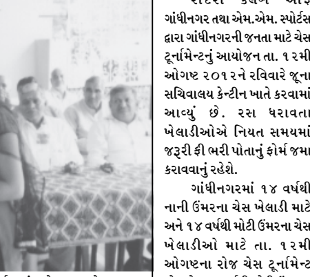
ગાંધીનગર રોટરી ક્લબ ઓફ ગાંધીનગર તથા એમ.એમ. સ્પોર્ટ્સ દ્વારા ગાંધીનગરની જનતા માટે ચેસ ટૂર્નામેન્ટનું આયોજન તા. ૧૨મી ઓગસ્ટ ૨૦૧૨ને રવિવારે જૂના સચિવાલય કેન્ટીન ખાતે કરવામાં આવ્યું છે. ૨૨૨ ધરાવતા ખેલાડીઓએ નિયત સમયમાં જરૂરી ફી ભરી પોતાનું ફોર્મ જમા કરાવવાનું રહેશે.

ગાંધીનગરમાં ૧૪ વર્ષથી નાની ઉંમરના ચેસ ખેલાડી માટે અને ૧૪ વર્ષથી મોટી ઉંમરના ચેસ ખેલાડીઓ માટે તા. ૧૨મી ઓગસ્ટના રોજ ચેસ ટૂર્નામેન્ટ યોજાશે. ૧૪ વર્ષથી મોટી ઉંમરના ખેલાડીઓ માટે ૧૫૦ રૂ. ફી તથા ૧૪ વર્ષથી નાની ઉંમરના ખેલાડીઓ માટે ૧૨૦ રૂ. ફી નક્કી કરવામાં આવી છે. ૧૪