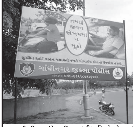
ટ્રાફિક નિયમન મુંબેશ અભિયાન : ટ્રાફિકના નિયમો માટે જાનગૃહિ અભિયાન રૂપે ગાંધીનગર ટ્રાફિક પોલીસ દ્વારા ગાંધીનગરના માર્ગો ઉપર તથા શાળાઓના પ્રવેશ દ્વાર પાસે ટ્રાફિક નિયમન અંગેના હોર્ડીંગ્સ મૂકાયા છે. હેલમેટ અને સીટબેલ્ટ માટે વધારે ભાર અપાયો છે.

વિધી કરવાના બહાને ગૃહિણીને ભોળવી દાગીના ઉતરાવ્યા અને આ મુકવાનું કહીને ૮૨ હજારની મત્તા લઈ બંને ગઠીયા ફરાર : સે-૨ ૧ માં બનેલી ઘટના ગાંધીનગર, તા. ૬ કાળો લઈ લીધા બાદ તમને નડતર છે એટલે દુઃખ દુર કરવું હોય તો વિધી કરવી પડશે તેવી રગ પકડીને ગૃહિણીને વિધી કરવાના બહાને ભોળવી દાગીના ઉતરાવ્યા. ૬ હજાર રોકડા મુકાવી ૩.૨૮ હજારની મત્તા ઉપાડી લીધી હતી અને ગૃહિણીને આ મુકવાનું કહીને ૮૨ હજારની મત્તાનો યુનો ચોપડી બંને ફરાર થઈ ગયા હતાં. સે-૨ ૧ પોલીસે ગૃહિણીને ફરિયાદ નોંધી તપાસ શરૂ કરી છે. ગાંધીનગર શહેરનાં સે-૨ ૧ પંચશીલ પાક સોસાયટીમાં કિત્તરના વેશમાં બહુચરમાતાનો ફાળો ઉતરાવવાના બહાને બે ગઠીયાઓએ ગૃહિણીને ટોર્ગેટ બનાવી અને ૩.૨૦ કરોડો લઈ લીધા બાદ તમને નડતર છે એટલે દુઃખ દુર કરવું હોય તો વિધી કરવી પડશે તેવી રગ પકડીને ગૃહિણીને વિધી કરવાના બહાને ભોળવી દાગીના ઉતરાવ્યા. ૬ હજાર રોકડા મુકાવી ૩.૨૮ હજારની મત્તા ઉપાડી લીધી હતી અને ગૃહિણીને આ મુકવાનું કહીને ૮૨ હજારની મત્તાનો યુનો ચોપડી બંને ફરાર થઈ ગયા હતાં. સે-૨ ૧ પોલીસે ગૃહિણીને ફરિયાદ નોંધી તપાસ શરૂ કરી છે. ગાંધીનગર શહેરનાં સે-૨ ૧ પંચશીલ પાક સોસાયટીમાં કિત્તરના વેશમાં બહુચરમાતાનો ફાળો ઉતરાવવાના બહાને બે ગઠીયાઓએ ગૃહિણીને ટોર્ગેટ બનાવી અને ૩.૨૦ કરોડો લઈ લીધા બાદ તમને નડતર છે એટલે દુઃખ દુર કરવું હોય તો વિધી કરવી પડશે તેવી રગ પકડીને ગૃહિણીને વિધી કરવાના બહાને ભોળવી દાગીના ઉતરાવ્યા. ૬ હજાર રોકડા મુકાવી ૩.૨૮ હજારની મત્તા ઉપાડી લીધી હતી અને ગૃહિણીને આ મુકવાનું કહીને ૮૨ હજારની મત્તાનો યુનો ચોપડી બંને ફરાર થઈ ગયા હતાં. સે-૨ ૧ પોલીસે ગૃહિણીને ફરિયાદ નોંધી તપાસ શરૂ કરી છે.