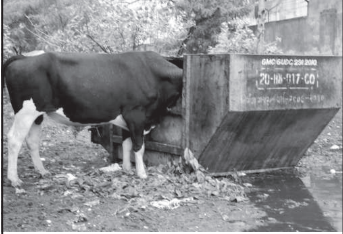
કચરા પેટી ઝાલી ભોજનશાળા : ગાંધીનગરમાં ઠેર ઠેર મુકાયેલી ખુલ્લી કચરાપેટીને રખડતા ઘોર ભોજનશાળા બનાવે છે. એટલા સહિતનો કચરો કચરાપેટીમાં ઠલવાય છે અને જતાં આવતાં ઘેરો માંખી ખાય અને ગંદકી કરે સરવાળે સમગ્ર વિસ્તારમાં મચ્છરોનું ઉત્પાદન કેન્દ્ર બની જાય છે.

ગાંધીનગર, તા. ૬ હોલ ખાતે યોજનારો ગાંધીનગર શહેર આધારકાર્ડ કઠાવવાનો કેમ્પ મોકુફ રખાયો છે. આધારકાર્ડ કરાવવા માટે સેક્ટર-૮ અંબલેશ્વર જાણવું છે કે, આજે તા. ૭મી મહાદેવ મંદિર ખાતે આજે જુલાઈના રોજ સેક્ટર-૮ કેમ્પનું આયોજન કરવામાં આવ્યું હતું. પરંતુ આધાર કાર્ડ કઠાવનાર એજન્ટોના કર્મચારીઓ હસ્તાલ ઉપર હોવાથી તે કેમ્પ મોકુફ રાખવામાં આવ્યો છે. હવે પછી ફરી કેમ્પ યોજવાની તારીખ બાહેર કરવામાં આવશે જેની નોંધ સર્વે પેન્શનર્સ સભ્યોએ લેવી.