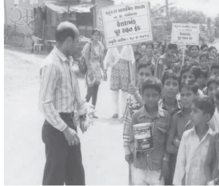
ચિલોડા, તા. ૮ ગાંધીનગર તાલુકાની મહુન્દ્રા પ્રાથમિક શાળાના બાળકોએ માનવતા અને માણસાઈના દીવા પ્રગટાવવા

દુખીયાના વહારે જવા તાજેતરમાં કુદરતી આફત તરીકે ઉત્તરાખંડ જળપ્રલયમાં મૃતકોને શાંતિ અર્પે તથા પુરપિડિતોને મદદરૂપ થવામાં રાહત લોકકાળો એકત્રિત કરવાનું બીડું ઝડપ્યું. આ શાળાના બાળકોએ વેપારીઓ, વાહનચાલકો, રીક્ષાચાલકો પાસેથી