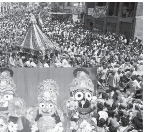
અમદાવાદ અને જગન્નાથપુરીની રથયાત્રાનું જીવંત પ્રસારણ કરાશે

ગાંધીનગર, તા. ૮ પ્રસારણ કરવા માટે ઈટીવી એ અત્યાધુનિક ટેકનોલોજી અને મલ્ટીપલ કેમેરા સહિત અત્યંત અનુભવી ટીમને રોકી છે. ઈટીવી પર રથયાત્રાનું જીવંત પ્રસારણ અમદાવાદ અને જગન્નાથપુરીથી કરવામાં આવશે. સાથ સાથે અન્ય શહેરોમાં થતી પણ રથયાત્રાની ઝલક પણ દર્શાવવામાં આવશે. તા. ૧૦ જુલાઈ ૨૦૧૩ના રોજ ઈટીવી બક્તિભાવભર્યું આમંત્રણ છે.