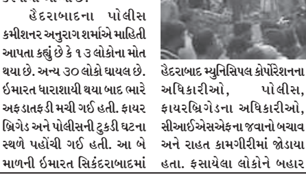
સિકંદરાબાદમાં આજે સવારે બે માળની હોટેલની ઈમારત ધરાશયી થઈ જતાં ઓછામાં ઓછા ૧૩ લોકોના મોત થઈ ગયા છે અને અન્ય ૩૦ લોકો ઘાયલ થયા છે જે પૈકી કેટલાકની હાલત ગંભીર જણાવવામાં આવી છે.

સિકંદરાબાદ, તા. ૮ સિકંદરાબાદમાં આજે સવારે બે માળની હોટેલની ઈમારત ધરાશયી થઈ જતાં ઓછામાં ઓછા ૧૩ લોકોના મોત થઈ ગયા છે અને અન્ય ૩૦ લોકો ઘાયલ થયા છે જે પૈકી કેટલાકની હાલત ગંભીર જણાવવામાં આવી છે. કાટમાળ હેઠળ ઘણા લોકો હજુ પણ ફસાયેલા હોવાનું જણવા મળ્યું છે. હાલ તો દુર્ઘટનાના મામલામાં તપાસનો આદેશ કરવામાં આવ્યો છે.