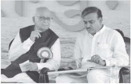
આજની બેઠકમાં ચર્ચા કરવામાં આવી હતી આ ઉપરાંત આગામી લોકસભાની ચૂંટણી માટે વ્યૂહરચના

કરતા તેમણે કહ્યું હતું કે દેશમાં વર્તમાન રાજકીય સ્થિતિ ઉપર અને રૂપરેખા પર ચર્ચા થઈ હતી. આગામી લોકસભાની ચૂંટણી માટે આજની બેઠકમાં ચર્ચા કરવામાં આવી હતી આ ઉપરાંત આગામી લોકસભાની ચૂંટણી માટે વ્યૂહરચના