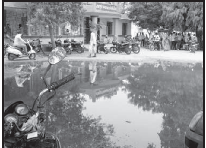
ડીસા શહેરની તાલુકા પંચાયત કચેરીની આગળ-પાછળ વરસાદી પાણી ભરાતા કચેરીમાં કામ અર્થે આવતા અરજદારોને ભારે હાલાકી વેઠવી પડે છે. તાલુકા પંચાયતની પાછળની બાજુએ આવેલ બી.આર.સી. ભવનની સામે ઘુંટણસમુ પાણી ભરાયેલ છે. જ્યાં આજે શિક્ષકોની મીટીંગ હોવાથી મીટીંગમાં આવેલા શિક્ષકોને ભારે મુશ્કેલીનો સામનો કરવો પડ્યો હતો. આ સમસ્યા દર વર્ષે ચોમાસાની ઋતુમાં સર્જાય છે. આખા તાલુકાનો વહીવટ જ્યાંથી થતો હોય તે તાલુકા પંચાયતમાં જ હુંટણ સમા વરસાદી પાણીનો ભરાવો થાય છે. જો તાલુકા પંચાયત જ પાણીમાં ગરકાવ હોય તો ગામડાઓની શુ પરિસ્થિતિ હશે? પરંતુ આ અંગે તંત્રના અધિકારીઓ ધૂતરાપ્ટ્રની ભૂમિકા ભજવી રહ્યા હોય તેવું લોકોને લાગી રહ્યું છે.

જ્યારે કેટલાક નવયુવાનો બુટલેગરોના સંક્રમમાં સપડાયા હોવાથી તેઓ પોતાની બાઈક પર દારૂની હોમ ડીલીવરી પણ બુટલેગરોના કહેવાથી કરતા હોય છે ત્યારે શહેરમાંથી દેશી વિદેશી દારૂનું નેટવર્ક ઓછું કરવા જિલ્લા પોલીસ વડા તાત્કાલીક યોગ્ય પગલા ભરે તેવી લોકોની લાગણી અને માંગણી છે.