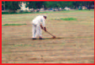
નગરની મધ્યમાં આવેલી ઉપર છેલ્લા થણા વરસોથી આ ન્યાયપાલિકા અને બહુમાળી કચેરીની જમીનના માલિક પરંતુ સરકાર દ્વારા

ગાંધીનગર, તા. ૧૫ ખેતર મોટાભાગે ગામને છેવાડે સીમમાં આવેલું હોય છે. શહેરની આસપાસ તો દૂર દૂર સુધી એકાદ નાનું ખેતર પણ જોવા મળતું નથી. પરંતુ ગાંધીનગરની અન્ય કેટલીક અજાયબીઓની જેમ શહેરની બીલકુલ મધ્યમાં ખેતરો લહેરાતા હોય તેવું માન અહીં જ જોવા મળે છે. શહેરના આધુનિક બાળકોને ખેતર જોવા હવે દૂર જવાની જરૂર નથી. સેક્ટર-૧૧માં કોર્ટ અને કલેક્ટર કચેરીની બીલકુલ પાછળ ચોમાસાની ઋતુ દરમિયાન લીલાછમ ખેતરો જોવા મળી શકે