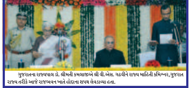
ગુજરાતના રાજ્યપાલ ડૉ. શ્રીમતી કમલાજીએ શ્રી વી.એસ. ગઢવીને રાજ્ય માહિતી કમિશ્નર, ગુજરાત રાજ્ય તરીકે આજે રાજ્યભવન ખાતે હોદ્દાના શપથ લેવડાવ્યા હતા.

શહેરના અન્ય વિસ્તારના બેઝ્ટમાં મહાત્મા મંદિરના નિર્માણની સાથે સ્વર્ણમ પાર્કની મહત્વકાંક્ષી યોજનાનું કામ ચાલી રહ્યું છે. સ્વર્ણમ પાર્કનું પ્રથમ તબક્કાનું કામ પૂર્ણ થઈ ગયું છે. જ્યારે ફેઝ-૨ની કાર્યયોજના સંદર્ભે ડ્રીમ પ્રોજેક્ટનું કામ અટવાયું છે. મહાત્મા મંદિરથી લઈ સચિવાલય સુધીના પ્રેરણા, પુરપાર્થ અને પરિણામની વાતને સાર્થક કરતા આ કાર્યયોજના અન્વયે આગળ નદીના કોતર વિસ્તારમાં પંચામૃત ભવનના નિર્માણ કરવાનું પણ આયોજન કરવામાં આવ્યું છે. પંચામૃત ભવનના નિર્માણનું કામ હાથ ધરવા લાંબા સમયથી આયોજન ચાલી રહ્યું છે. જ્યારે હજુ સુધી ભવનના