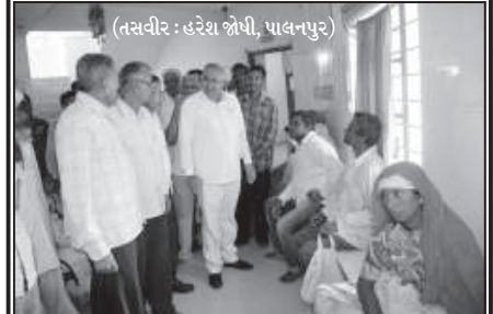
અને સફાઈ કામદારો ફરજ પ્રત્યે સભાન બન્યા હતા. ચોમાસાની સીઝન દરમિયાન કાદવવિદ્ય અને બચકચરાને લીધે મચ્છરોનો ઉપવેશ પણ ભારે વધી ગયો છે. શહેરના કુલ ૧૪ વોર્ડમાં ૨૫૦ જેટલા સફાઈ કામદારો કામ કરી રહ્યા છે અને સફાઈની સાથે સાથે ડી.ટી.ટી. પાઉન્ડરનો પણ છંટકાવ કરી રહ્યા છે. સફાઈ કામદારો પર દેખરેખ રાખતા અને હાજરીપત્રક નિભાવતા મુકાદમો ઘણા લાંબા સમયથી એક જ જગ્યાએ ફરજ બજાવતા હતા. તેઓની એક સાથે જુદી જુદી જગ્યાએ બદલીના દુકમો કરતા ભારે ફફટાટ ફેલાયો છે. સફાઈ મામલે આજે સેનિટેશન ટીમ ચેરમેન અનિલ ચક્રવર્તી દ્વારા આયોજીત તપાસ હાથ ધરી શહેરીજનો વેપારીઓને જાતે શિસ્ત જાળવી શહેરને સ્વચ્છ રાખવા સહકાર આપવા નાગરિકોને અપીલ કરવામાં આવી હતી.

પાલનપુર, તા. ૧૮ પાલનપુરમાં ચોમાસાની સીઝન અગાઉ જાહેર વિસ્તારોની મોટી ગટર લાઈનો ભુગર્ભ રહેણાંક કોમર્શિયલ વિસ્તારોની ગટરોની સફાઈ બાદ કચરાના ઢગલા તેમજ કચરાપેટીઓ અંગે આજે અચાનક જ સેનિટેશન ટીમના અધિકારીઓએ તમામ વિસ્તારોમાં ઓર્થો ચેકિંગ હાથ ધર્યું હતું